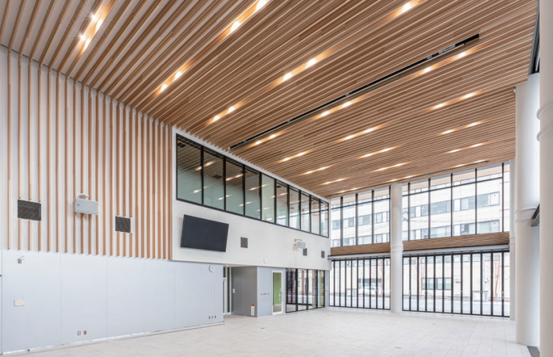
天井造作材: グラビオルーバー US<大崎市産杉> 耐震天井工法: ダイケンハイブリッド天井