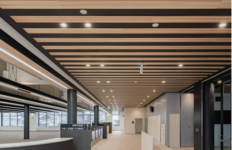
天井材: 大崎産スギ突板張り ダイライト不燃パネル