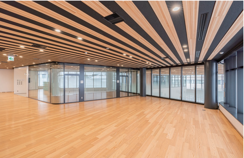
天井材: 大崎産スギ突板張り ダイライト不燃パネル 床材: コミュニケーションタフII FW(地域産材対応突板)<大崎市産杉>