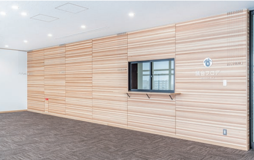
壁材: 大崎産スギ突板張り ダイライト不燃パネル