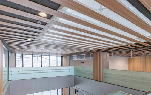
天井材: 大崎産スギ突板張り ダイライト不燃パネル