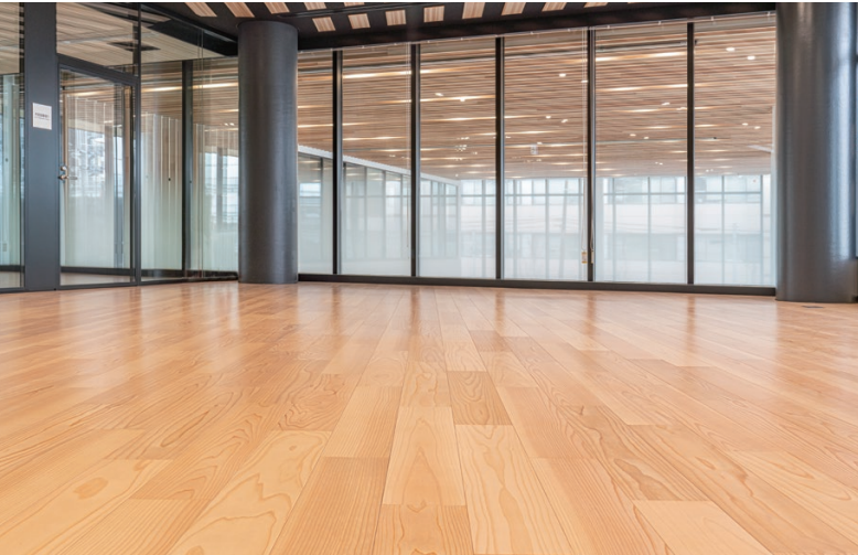
床材: コミュニケーションタフII FW(地域産材対応突板)<大崎市産杉>