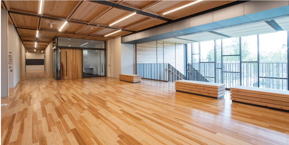
床材:コミュニケーションタフ DW (地域産材対応突板)〈八代産杉材〉