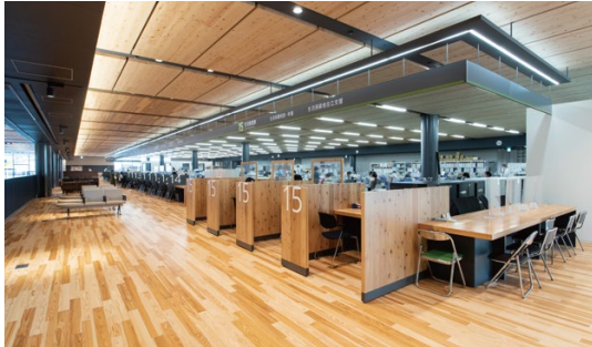
床材:コミュニケーションタフ DW (地域産材対応突板)〈八代産杉材〉