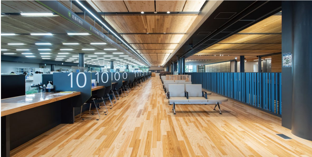
床材:コミュニケーションタフ DW (地域産材対応突板)〈八代産杉材〉