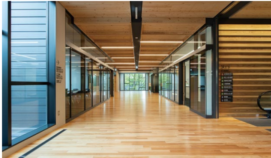
床材:コミュニケーションタフ DW (地域産材対応突板)〈八代産杉材〉