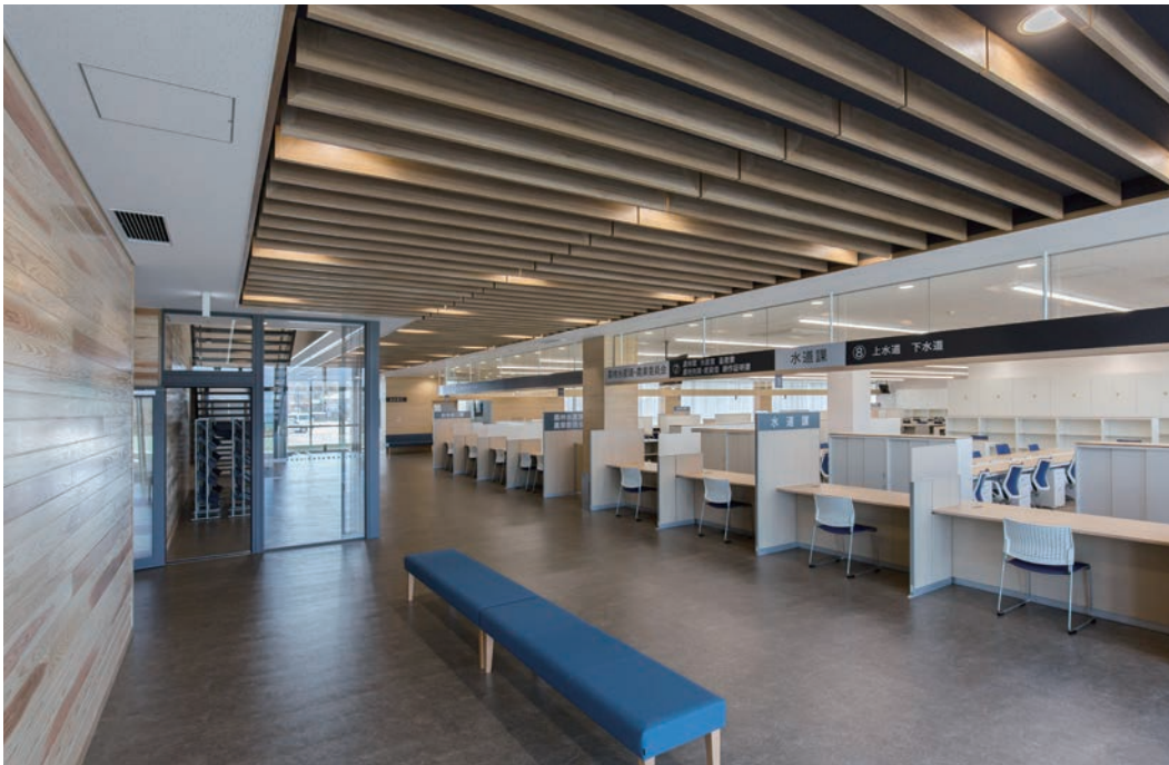
天井造作材:グラビオルーバー UB<ライトオーカー> 天井材:ダイロートン トラバーチン 9mm