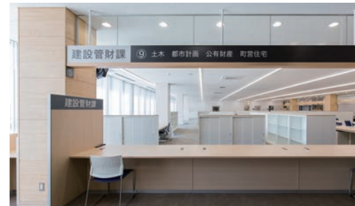
不燃壁材:グラビオUB<UB71> 天井材:ダイロートン トラバーチン 9mm