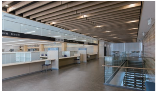
天井造作材:グラビオルーバー UB<ライトオーカー> 天井材:ダイロートン トラバーチン 9mm