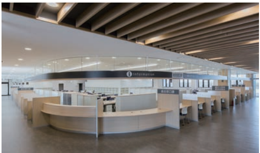
天井造作材:グラビオルーバー UB<ライトオーカー> 天井材:ダイロートン トラバーチン 9mm