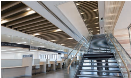
天井造作材:グラビオルーバー UB<ライトオーカー> 天井材:ダイロートン トラバーチン 9mm