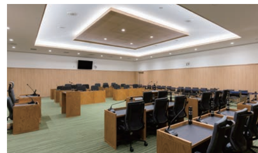
不燃壁材:グラビオUB<UB73> 天井材:ダイロートン トラバーチン 9mm