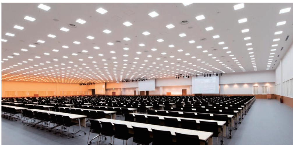
耐震天井工法：ダイケンハイブリッド天井 天井材：ダイロートン トラバーチン 12mm