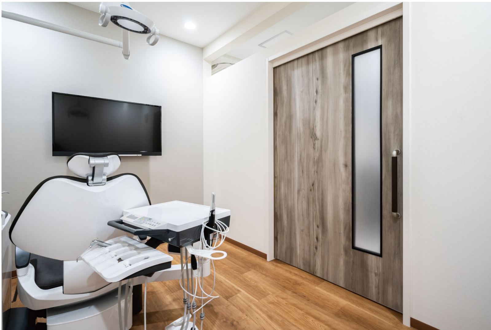
室内ドア: おもいやりドア〈スモークグレー〉