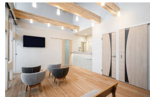
壁材・腰壁: グラビオエッジ ブロック 〈アイボリー〉