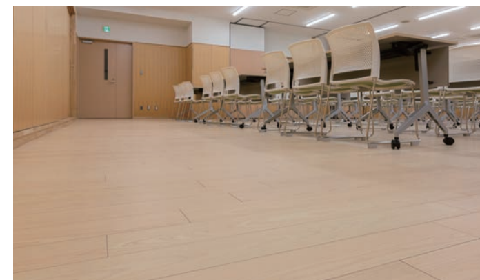
床材：コミュニケーションタフ ケア(地域産材対応突板)〈埼玉県産檜〉