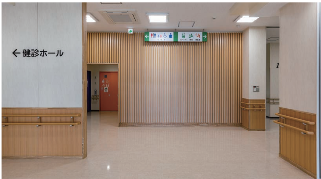
壁材・腰壁：埼玉県産材スギ突板張り ダイライト不燃パネル 壁造作材：埼玉県産材スギ突板張り ダイライト不燃ルーバー