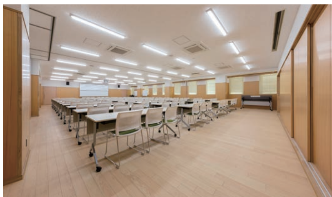
床材：コミュニケーションタフ ケア(地域産材対応突板)〈埼玉県産檜〉