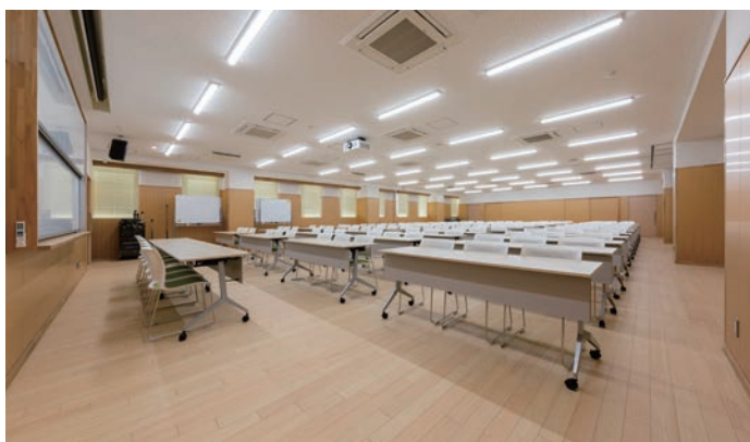
床材：コミュニケーションタフ ケア(地域産材対応突板)〈埼玉県産檜〉