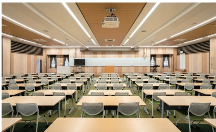
壁材・腰壁：グラビオUB木目柄〈クリアベージュ〉・〈ミルベージュ〉・〈UB76〉