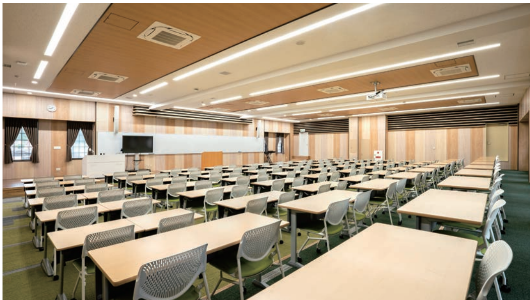
壁材・腰壁：グラビオUB木目柄〈クリアベージュ〉・〈ミルベージュ〉・〈UB74〉