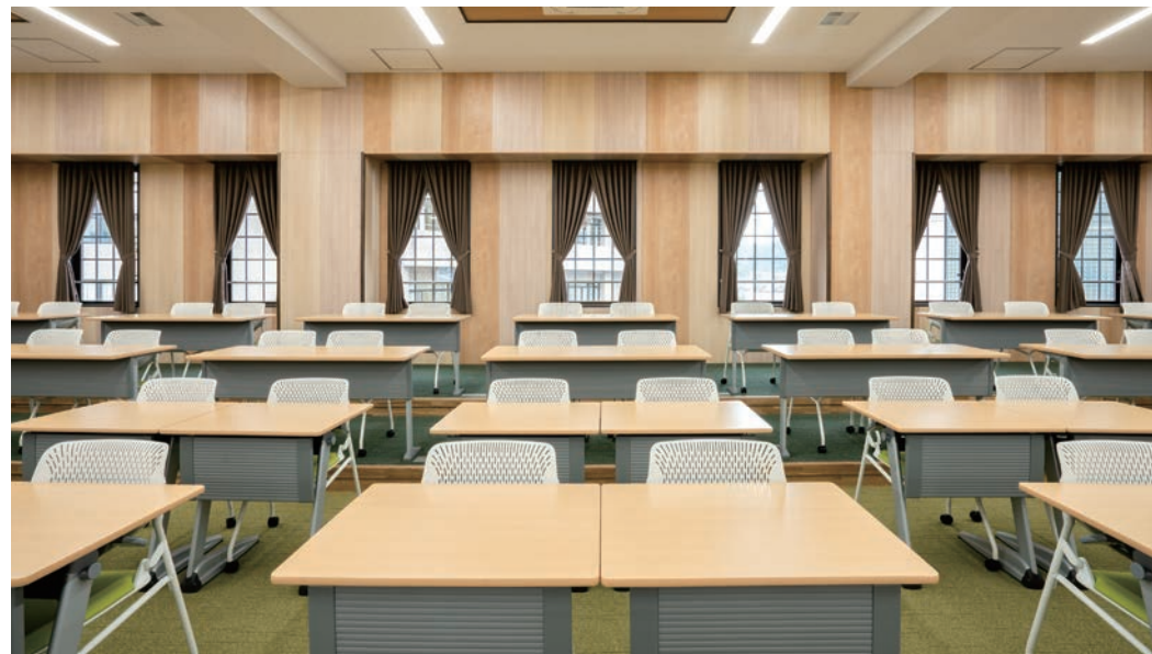
壁材・腰壁：グラビオUB木目柄〈クリアベージュ〉・〈ミルベージュ〉・〈UB75〉