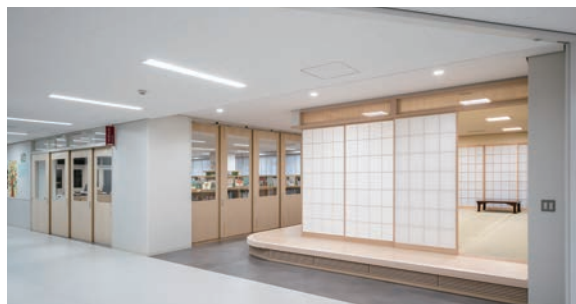
耐震天井工法：ダイケンハイブリッド天井 天井材：ロックウール化粧吸音板 ダイロートン ギンガ4