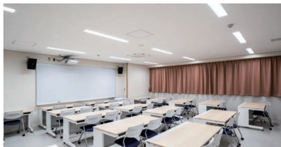
耐震天井工法：ダイケンハイブリッド天井 天井材：ロックウール化粧吸音板 ダイロートン ギンガ4