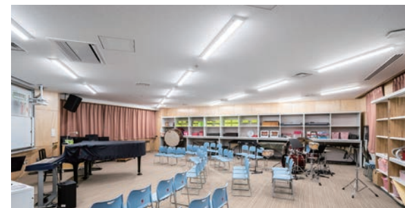
耐震天井工法：ダイケンハイブリッド天井 天井材：ロックウール化粧吸音板 ダイロートン ギンガ4