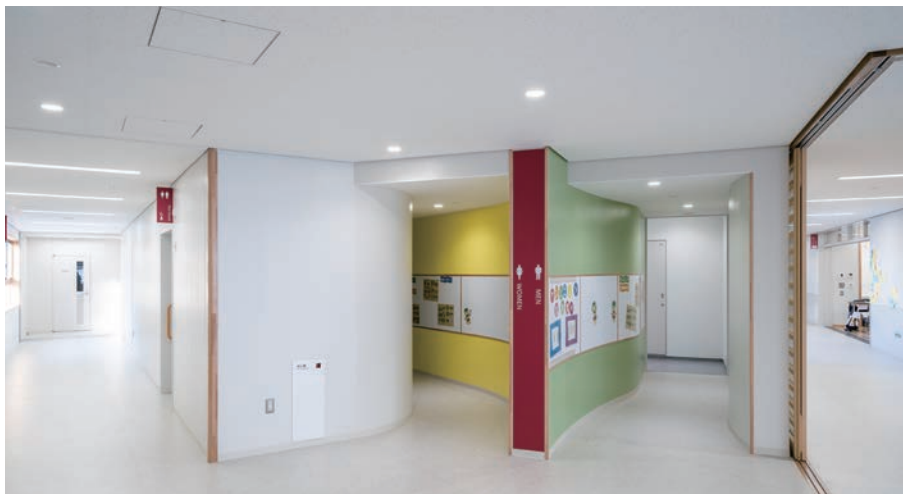
耐震天井工法：ダイケンハイブリッド天井 天井材：ロックウール化粧吸音板 ダイロートン ギンガ4