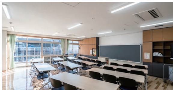
耐震天井工法：ダイケンハイブリッド天井 天井材：ロックウール化粧吸音板 ダイロートン ギンガ4