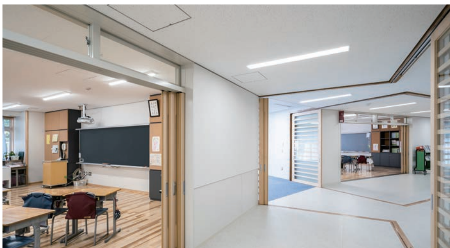
耐震天井工法：ダイケンハイブリッド天井 天井材：ロックウール化粧吸音板 ダイロートン ギンガ4