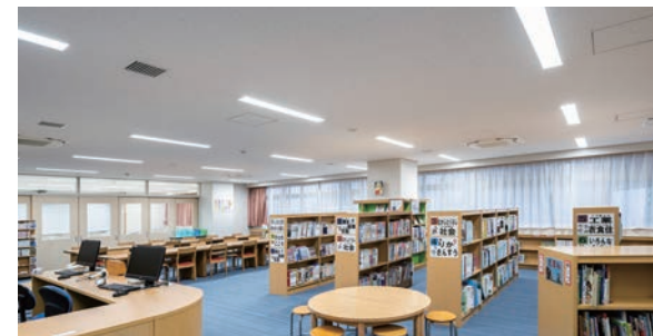
耐震天井工法：ダイケンハイブリッド天井 天井材：ロックウール化粧吸音板 ダイロートン ギンガ4