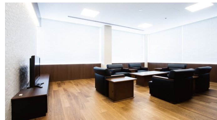
床材: 土足対応WPC床材 壁材: グラビオエッジ カーヴァ<ホワイト> 腰壁: グラビオUB<ダルブラウン>