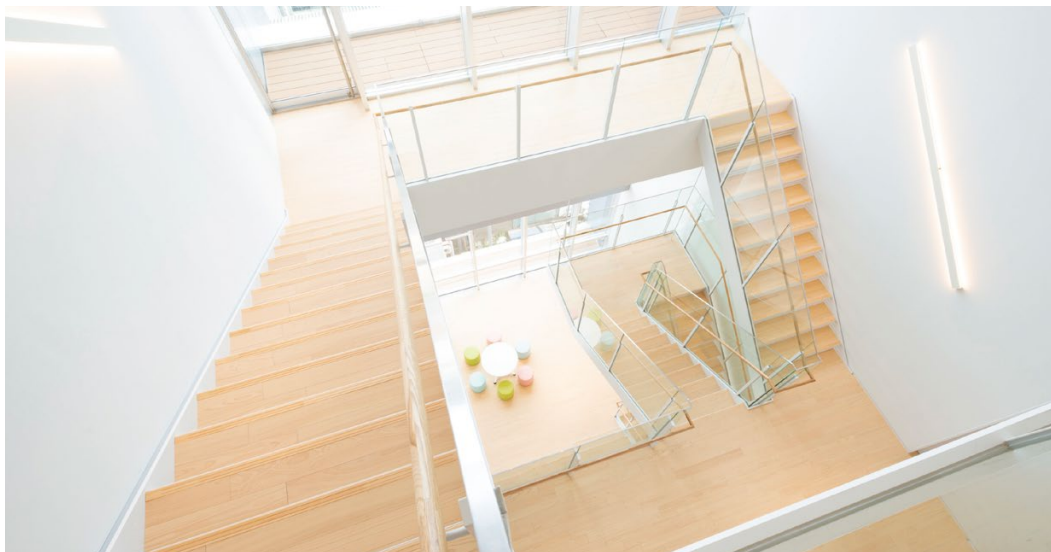
床材: コミュニケーションタフ DW<檜>