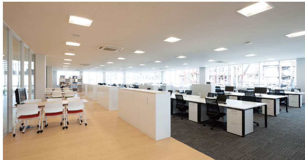
天井材: ロックウール化粧吸音板 ダイロートン ギンガ4 耐震天井工法: ダイケンハイブリッド天井 床材: コミュニケーションタフ DW<檜>