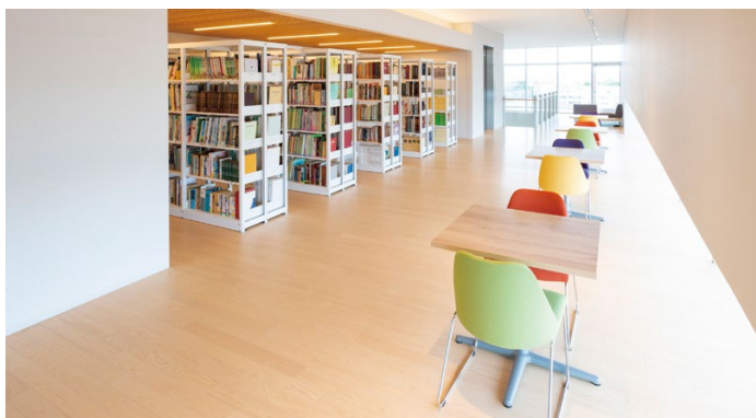
天井材: ロックウール化粧吸音板 ダイロートン ギンガ4 耐震天井工法: ダイケンハイブリッド天井 床材: コミュニケーションタフ DW<檜>