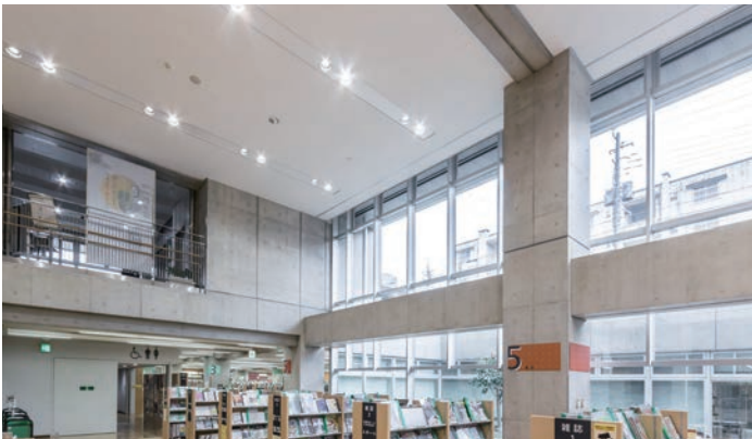
天井下地材：ダイケンハイブリッド天井 天井材：ダイロートン トラパーチン12mm