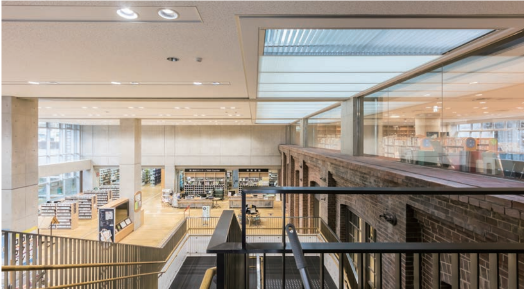
天井下地材：ダイケンハイブリッド天井 天井材：ダイロートン トラパーチン12mm