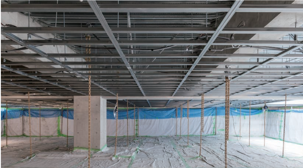
天井下地材：ダイケンハイブリッド天井