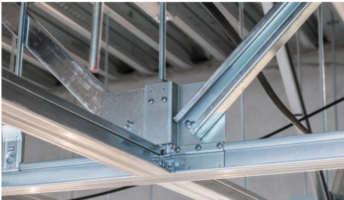
天井下地材：ダイケンハイブリッド天井