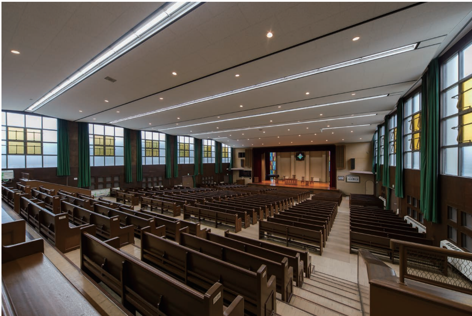
天井材:ロックウール化粧吸音板 ダイロートン スーパーワイド直張 トラバーチン 耐震天井工法:ダイケンハイブリッド天井