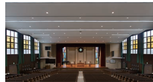
天井材:ロックウール化粧吸音板 ダイロートン スーパーワイド直張 トラバーチン 耐震天井工法:ダイケンハイブリッド天井