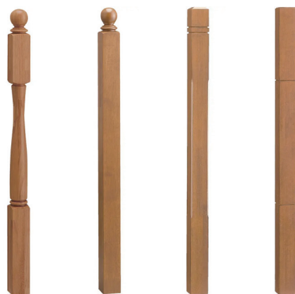
手摺子バリエーション