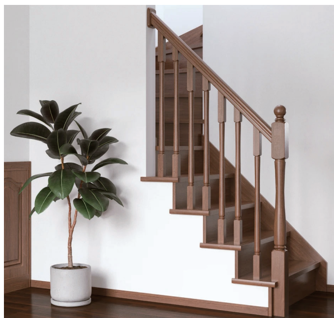
手摺バリエーション