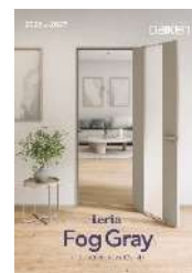
〈フォググレー柄〉カタログ

新色〈フォググレー柄〉は、さまざまな素材感と美しく調和し、グレー系の壁紙ともコーディネートしやすいミディアムトーンの無地調なグレーカラーです。控えめで落ち着いた色合いながら、空間全体に上質で洗練された雰囲気をもたらします。また、わずかに黄みを感じる絶妙なカラー設計により、木質素材や石質素材とも自然に溶け合い、多様なインテリアデザインに合わせやすいのが特長で、ナチュラルで安らぎのある空間や、都会的でシックなスタイル、ミニマルでシンプルなインテリアなど、住むほどに心地よさが広がるオリジナルな空間づくりを実現します。