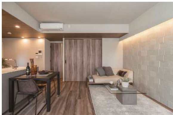
リビング空間 (正面のドアと床材がバームブラウン柄)

床材と建具には、床材『イエリアフロア セレクト プレミアムウッド柄』と新建具シリーズ『イエリア セレクト』に、昨年新たに追加した、表情豊かな木質感の〈バームブラウン柄〉を採用いただいています。各部屋をトレンドカラーの“温かみのあるブラウン”で統一することで、空間に落ち着きと上質感を持たせました。