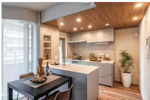
キッチン空間 (奥側の天井が『グラビオ羽目板V』)

木目や石目など素材感の引き立つ建材を空間のアクセントとして使用しています。キッチンの天井部分には、木目の立体感ある風合いが魅力で不燃性にも優れた天井材『グラビオ羽目板V』を、リビングの壁面(一面のみ)には、石目柄の深彫調不燃壁材『グラビオエッジ』を採用いただきました。