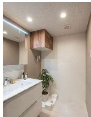
洗面空間 (奥の壁が『さらりあ〜と』、 天井が『クリアトーン 12SⅡ』)

洗面室・寝室の壁材には、空間の湿度に合わせて湿気を吸収・放出する調湿機能や、消臭機能を有する調湿壁材『さらりあ〜と シンプルクリーン』を、天井材には、音を吸収し、気になる反響音を抑え、かつ調湿性能も併せ持つダイロートン健康快適天井材『クリアトーン12SⅡ』を採用いただいています。当社機能建材の組み合わせにより、「調湿」「消臭」「吸音」の3つの性能を取り入れた、快適空間を実現しました。