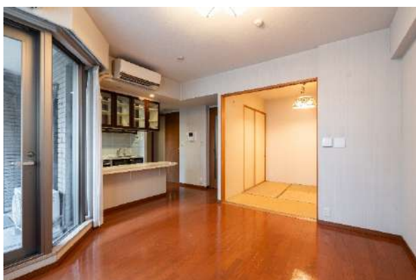
リノベーション前

DAIKEN株式会社（東京都千代田区、社長：清洲忠洋）は、このほど、首都圏エリアでマンションの販売を手掛ける明和地所株式会社との共同プロジェクトとして、当社の機能建材を多数用いて、東京都 文京区内のマンションの一室をリノベーションいたしました。立地や設備だけでなく、+αの付加価値が求められるリノベーション市場において、当社は、機能性・意匠面に優れた、空間の価値向上に寄与する製品の提案を通じて、誰もが過ごしやすい快適空間づくりに貢献してまいります。