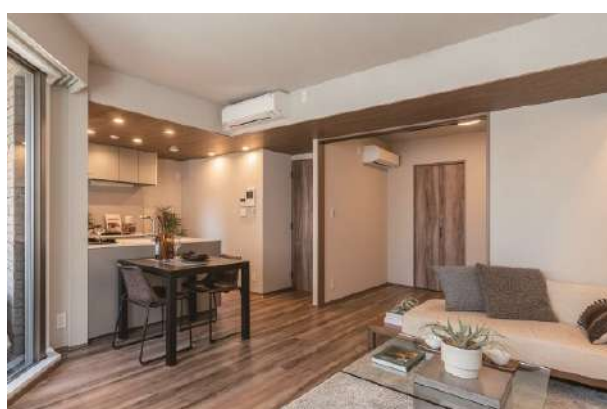
リノベーション後