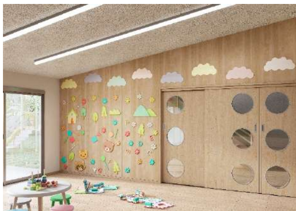
不燃壁材『グラビオ JA』空間イメージ