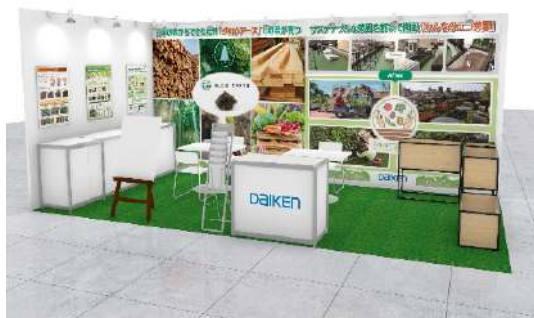
スマートビルディング EXPO 当社ブースイメージ

「スマートビルディング EXPO」では、ビルの緑化や屋上菜園の導入などに役立つ製品として、国産材を活用した木質培地『グロウアース』と、同培地を活用した菜園システム『みんなのエコ菜園』をご紹介します。当日は、『みんなのエコ菜園』で用いるプランターをご用意し、菜園の雰囲気や、『グロウアース』の軽量さなどをご確認いただける展示内容としています。