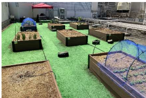
『みんなのエコ菜園』・『グロウアース』導入事例

ビルの屋上やマンション・オフィス等の共用部など、都市部の未活用なオープンスペースに簡単に導入できる菜園システムです。「都心で手軽に野菜を育てる」という“コト”提案を通して、人が集まり、緑あふれる開放的なコミュニケーションスペースの創出を目指します。