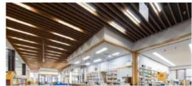
③ エンジニアリング情報