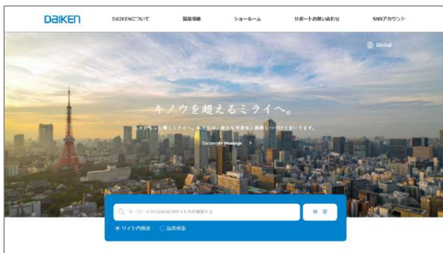
リニューアルサイトのTOPページ (PC画面)

2017年以来、6年ぶりとなる今回のリニューアルでは、品番や画像、施工説明書など、製品に関連する様々な情報をまとめて取得できるようにした製品データベース「D-Cata(ディーカタ)」を新たに構築したほか、サイト訪問者の半数以上を占めるスマートフォンユーザーの利便性をこれまで以上に高めるため、画面デザインやコンテンツ構成を刷新いたしました。