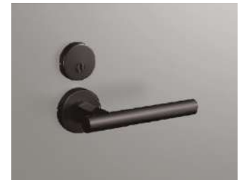
レバーハンドル (65 デザイン)