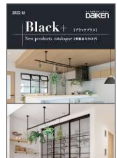
「ブラックプラス」 新製品カタログ 発刊日：12月21日

そこで当社は、リノベーション市場で人気のヴィンテージ調空間などをスタイリッシュに演出する「ブラック色」を基調に、空間を緩やかに仕切る室内窓部材『ルームウインドウ』や、多用途に活用できる『インテリアハンガー』など、暮らしへのこだわりに対応した2つの新製品を発売し、さらに、扉のレバーハンドルやカウンター用部材など、空間を構成する各種部材・金具にも「ブラック色」を追加設定いたしました。これにより、細部まで統一したこだわりのコーディネートが可能となるほか、空間を引き締める黒をアクセントに使うことで、木目や石目などの素材が引き立つ演出を実現します。また、提案ツールとしては、「ブラックプラス」をコンセプトとした新製品カタログを同時発刊いたしました。昨今人気の高いモダン、ナチュラル、ヴィンテージなど幅広い空間テイストに対応する新製品として、新築やリノベーション市場に向けた積極的な提案を進めてまいります。