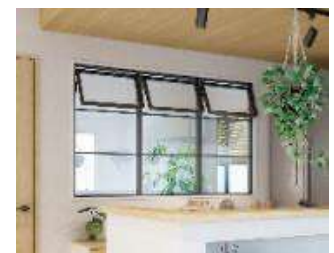
『ルームウインドウ』 フラップタイプ