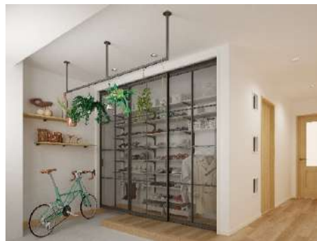
室内窓や金具に「ブラック色」を取り入れた空間イメージ