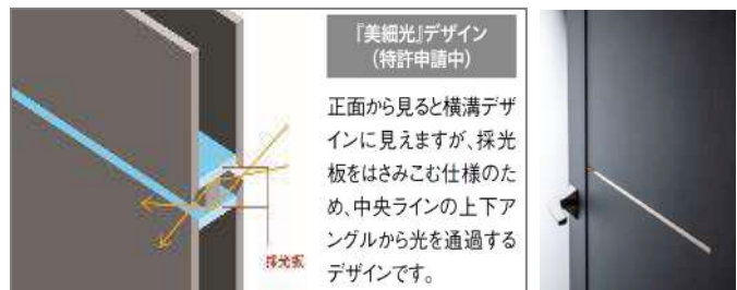
上図は B9 デザインの場合

意匠性と機能性を融合させた新しいコンセプト『美細光デザイン』は、室内にあまりが灯ると、やわらかい光が室外に漏れるため、さりげなく人の気配が感じ取れる当社独自のデザインです。B9、B1 デザインに採用しており、書斎や寝室などの個室にお勧めします。