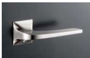
K7 デザイン (サテンニッケル)