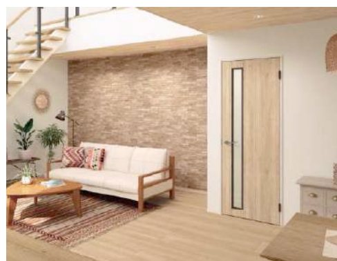
ドア:『hapia トレンドウッド調』 E7デザイン 新柄 PA (ミルキーオーカー) 採用の空間イメージ

当社は今後も、市場トレンドを先取りした、幅広い製品ラインアップを展開し、様々なお客様のご要望にお応えする空間作りに貢献してまいります。