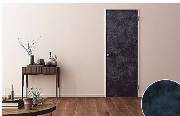
ドア:『hapia ソリッド調』 新柄 EC (コバルトブルー)

大建工業株式会社(大阪市北区、社長:億田正則)は、6月21日発売の2022年度新製品として、当社主力の住宅用内装建材「hapia」シリーズのドア・収納製品に、トレンドを先取りした新たな2柄を追加設定するとともに、個性豊かな5つのドアデザインを新たにラインアップいたします。個性的で存在感が際立つ特徴的な色柄・デザインを加えることで、空間コーディネート幅を広げ、質感にもこだわったワンランク上のライフスタイルをご提案いたします。