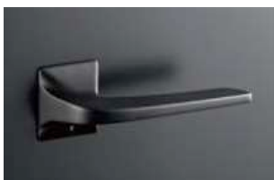
K7 デザイン (ブラック)