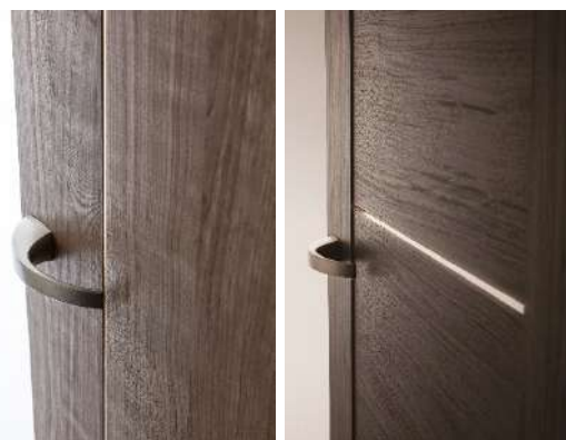
当社独自の新概念『美細光デザイン』を採用した新たなドアデザイン。左B1、右B9デザイン