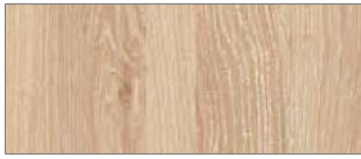
PA〈ミルクィーオーク〉