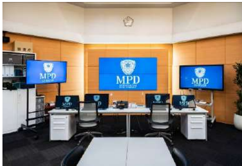
不燃壁材『グラビオフィット UB』(UB24)

同警視庁の会議室に、木目柄(UB24)が採用されました。 ダイライト基材の表面にコート紙を四方巻込むことで、製品の木口面に化粧を施し、製品端部をシャープに仕上げた不燃木目柄パネルです。また、オーダー通りのジャストサイズ、かつ木口面も化粧済の状態での出荷することにより、施工現場でのパネル切断や木口塗装が不要なため、現場作業が削減でき、工期短縮にも繋がります。