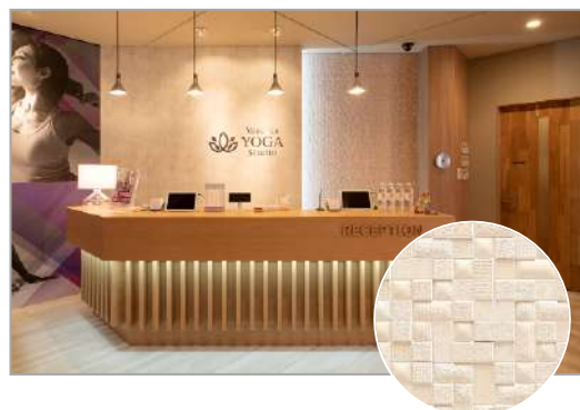
高意匠不燃壁材『グラビオエッジ』「ピアンテ」〈パールピンク〉

立体的なエンボス加工に特殊多彩塗装を施すことで実現した、エッジの効いた陰影と素材感のある意匠が特長です。「ピアンテ」は、布目のテクスチャーがやさしい雰囲気の陰影感を際立たせる、モザイクタイル調のデザインです。カラーパリエーションは柄の雰囲気に合わせた温かみのある6色を設定しています。