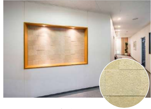
高意匠不燃壁材『グラビオエッジ』「カルセ」(ベージュ)

同警視庁に「カルセ」(ベージュ)が採用されました。 立体的なエンボス加工に特殊多彩塗装を施すことで、深みのある陰影を表現した、素材感のある意匠が特長です。「カルセ」は大谷石をモチーフとした各ピースの凹凸が重厚感を与える、石積み調のデザインです。