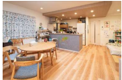
特殊加工化粧シート床材『トリニティ』〈オーク柄〉

『トリニティ』は、表面の質感にこだわり、広幅デザインで無垢材のような立体感のある美しい意匠が特長です。今回採用された〈オーク柄〉は、オークならではの虎斑や豊かな色合い、表情を再現しており、やさしく、あたたかみに包まれた木の味わいを住まいに描きます。