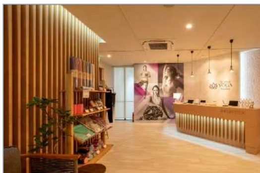
不燃造作材『グラビオルーバーUB』〈ミルベージュ〉