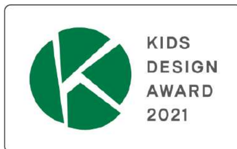
(左)『キントーン』施工イメージ (右)キッズデザインマーク