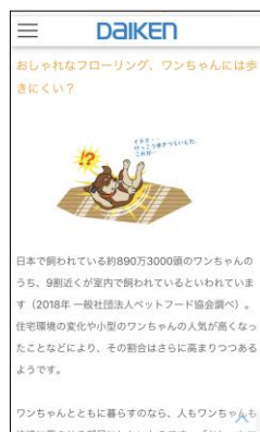
スマートフォンからの閲覧画面