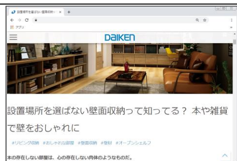
「DAIKEN REFORM MAGAZINE」コラムページ

理想の暮らしを叶える建材選びについて、豊富な機能性建材で快適空間を作り上げる当社ならではのノウハウをご紹介します。また、コラム中でご紹介した製品はカタログページ等への導線も設置しており、気になった製品は直ぐに詳細をご覧いただけます。