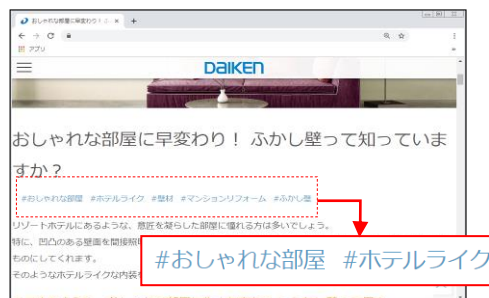
赤点線内がタグ情報

※「DAIKEN REFORM MAGAZINE」内の掲載情報が表示対象範囲です。