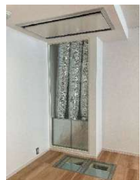
スケルトン構造により システムの内部を確認可能

体感ルーム①にはエアコンの室内機を同室内に設置、体感ルーム②には室内機を天井裏に設置しているため、「ユカリラ」導入時の設置状況の違いによる外観や運転音の大きさの違いなども併せて体感可能です。