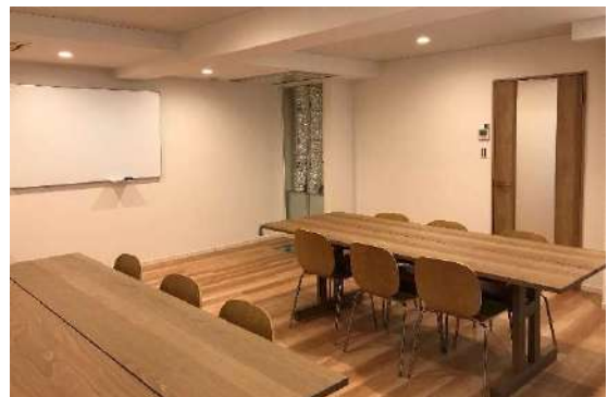
「ユカリラ体感ショールーム」体感ルーム①の様子

室内の空気質や温熱環境など、様々な基礎研究に取り組む当社は、快適空間の普及に向けて、体にやさしい冷暖房システム「ユカリラ」の提案活動を積極的に進めています。2020年4月には、同システムの販売を専門的に担う「快適空間部」を設けるなど新たな事業展開を進めており、その活動の一環として、この度、 当社初となる「ユカリラ体感ショールーム」 を東京都台東区に新設する運びとなりました。今後、新規顧客との接点強化をはじめ、「ユカリラ」の内部構造や優れた快適性をご理解いただくための営業拠点として有効活用し、さらなる提案力の強化を図ってまいります。