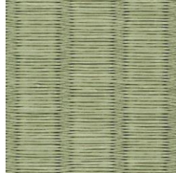
約 5,200 本/畳 銀白 極