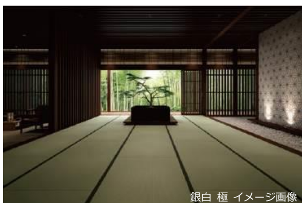
銀白 極 イメージ画像