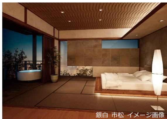
銀白 市松 イメージ画像