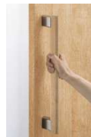
スリムにぎりバー