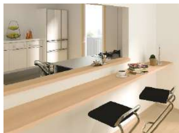
集成材カウンター(ゴム材)

『ビオタスク』機能に対応している「集成材カウンター(ゴム材)(イージーオーダーカウンター)」、「手摺セット 32 型 (I 型・L 型)」、「スリムにぎりバー」において、この度、抗ウイルス SIAA 認証を取得いたしました。