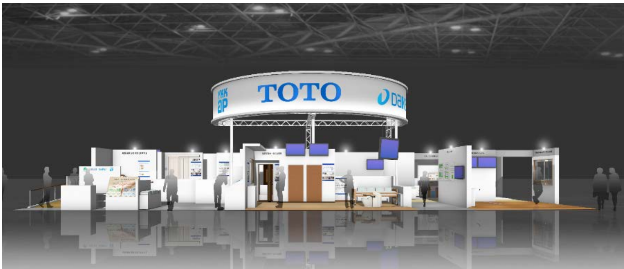
<TOTO・DAIKEN・YKK APブースイメージ>(パースイメージ)

TDYは、今後も一人でも多くの方がより使いやすいと感じるユニバーサルデザインの商品開発を進めることで、皆様に快適な暮らしを提案していきます。