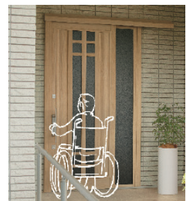
ドアリモ アウトセット玄関引戸 (YKK AP)