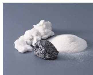
ダイライトの原料のロックウールとシラス

基材である「ダイライト」は、ロックウール(鉱物繊維)やシラス(火山性ガラス質材料)などを原料にした無機質素材であるため、防火性、耐腐食性能に優れています。また、表面材として使用している『グラビオUB 木目柄』も同じく不燃材料認定を取得しており、防火上の規制のかかる場所でもお使いいただけます。