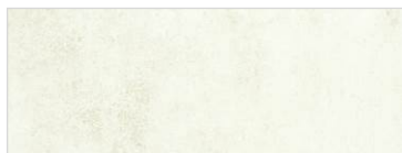
EH〈スタッコホワイト〉