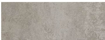
EG〈コンクリートグレー〉