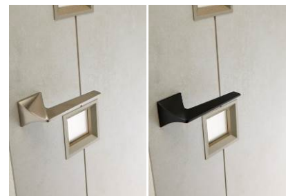
K5 デザイン レバーハンドル

※K5デザインのレバーハンドルは「hapia ソリッド調」専用ではありません。hapia シリーズの他の色柄のドアにもお使いいただけます。(オプション設定となります)