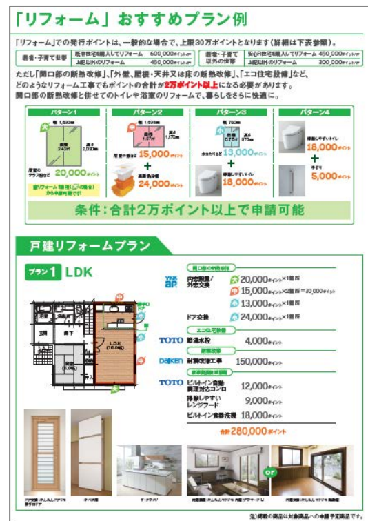
「次世代住宅ポイント制度活用ガイド」の解説ページ例

TDYでは、税制や補助・融資といった支援制度の認知を広げ、その制度をご活用いただくことで、お客様の理想の住まいづくりに貢献できると考えています。引き続き、対象商品の提案を含め、情報発信をすすめていきます。