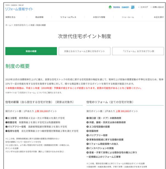
(右)次世代住宅ポイント制度紹介ページ