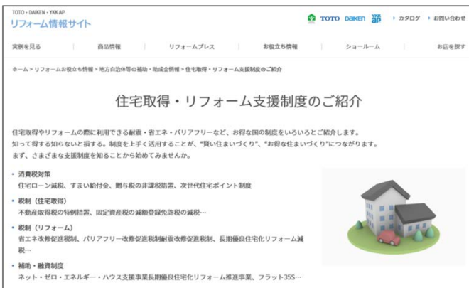
(上)住宅取得・リフォーム支援制度紹介ページ