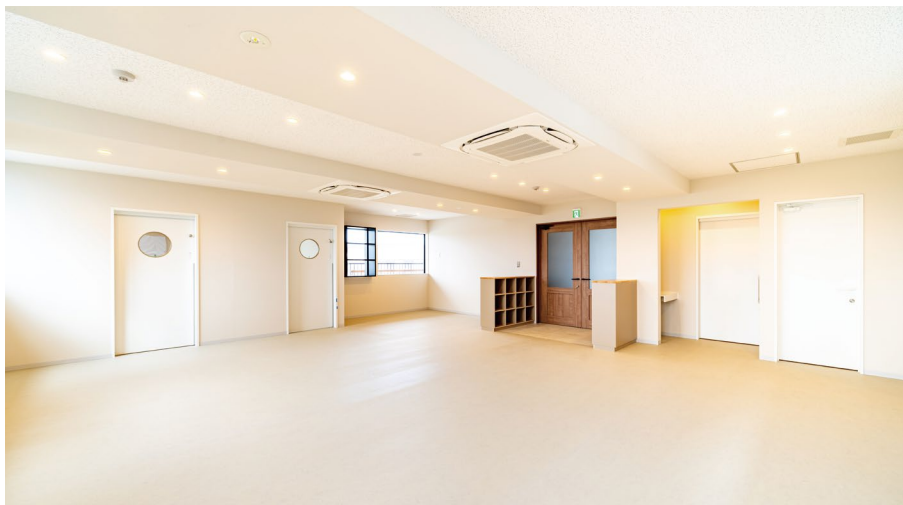
室内ドア (左側): OMOIYARIドア (特注品) 〈パウダーホワイト柄〉 室内ドア: OMOIYARIドア 〈パウダーホワイト柄〉・〈トープグレー柄〉 収納: 造作家具 (特注品)