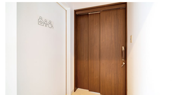
室内ドア (右側): OMOIYARIひきドアW 〈ダブルブラウン柄〉 室内ドア (左側): OMOIYARIドア 〈パウダーホワイト柄〉