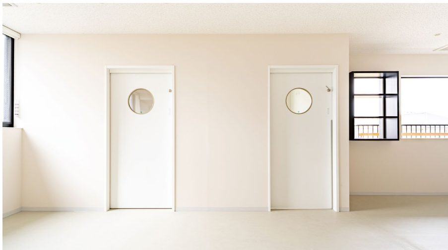
室内ドア: OMOIYARIドア (特注品) 〈パウダーホワイト柄〉