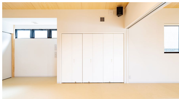
収納: 造作家具 (特注品)