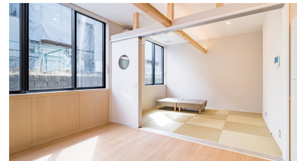
室内ドア: OMOIYARIドア (特注品) 〈パウダーホワイト柄〉