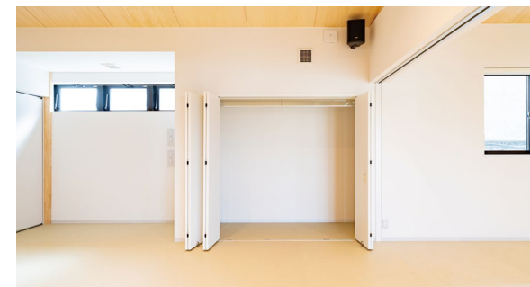
収納: 造作家具 (特注品)