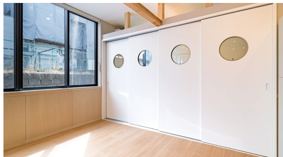
室内ドア: OMOIYARIドア (特注品) 〈パウダーホワイト柄〉