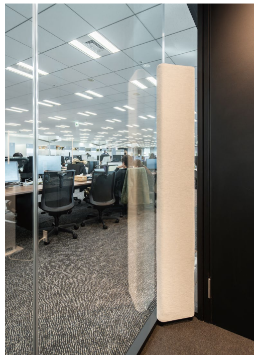
音響調整部材: CORNER TONE (コーナートーン)