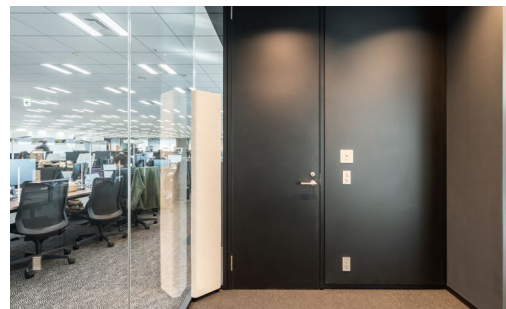
音響調整部材: CORNER TONE (コーナートーン)