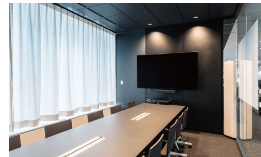
音響調整部材: CORNER TONE (コーナートーン)