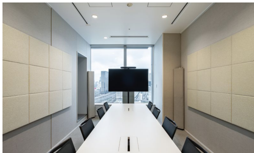
吸音パネル: OFF TONE (オフトーン) マグネットパネルN スクエア (四角形) 〈AN柄 (02)〉 音響調整部材: CORNER TONE (コーナートーン)