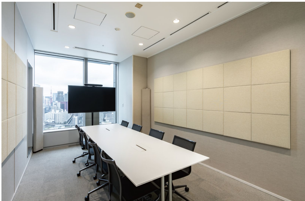
吸音パネル: OFF TONE (オフトーン) マグネットパネルN スクエア (四角形) 〈AN柄 (02)〉 音響調整部材: CORNER TONE (コーナートーン)