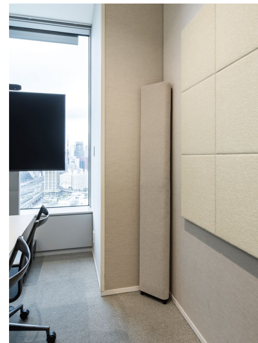
吸音パネル: OFF TONE (オフトーン) マグネットパネルN スクエア (四角形) 〈AN柄 (02)〉 音響調整部材: CORNER TONE (コーナートーン)