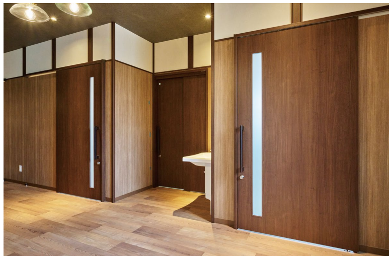
室内ドア：OMOIYARIドア〈ダルブラウン柄〉