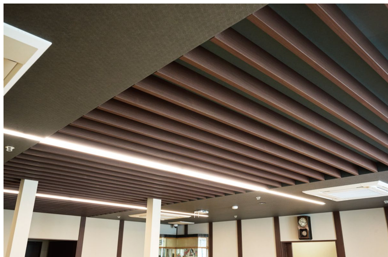
天井造作材：グラビオルーパー UB 直付式〈ダルブラウン柄〉