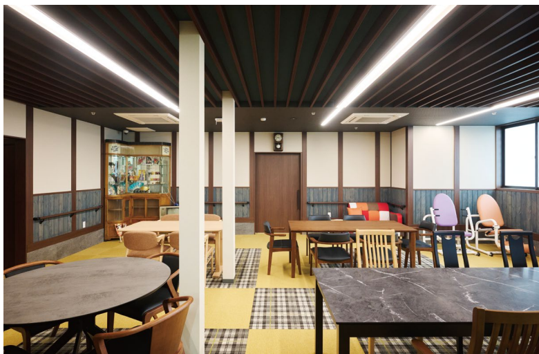
室内ドア：OMOIYARIドア〈ダルブラウン柄〉 天井造作材：グラビオルーパー UB 直付式〈ダルブラウン柄〉