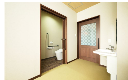
室内ドア：OMOIYARIドア〈ダルブラウン柄〉