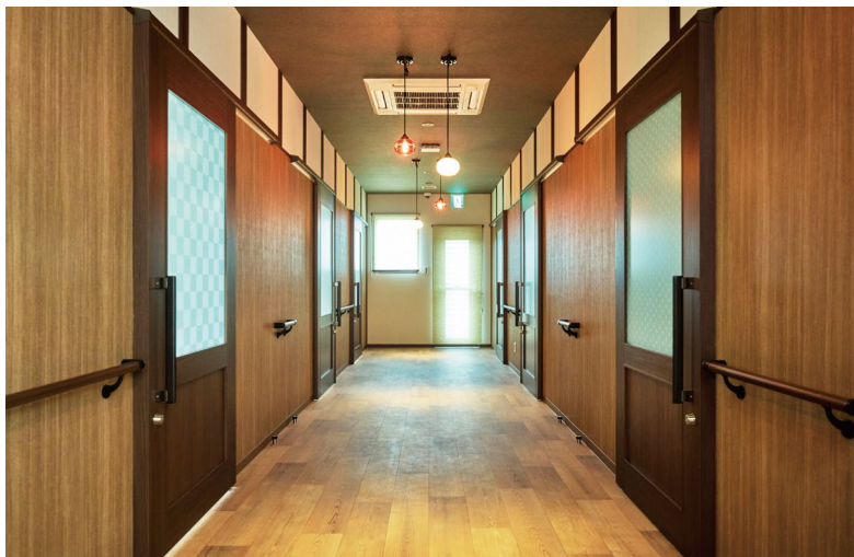
室内ドア：OMOIYARIドア〈ダルブラウン柄〉