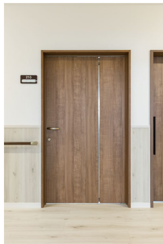
室内ドア：おもいやりドア（特注品）〈トープグレー柄〉 手摺：システム手摺35型 ゴム集成材タイプ手摺〈ダルブラウン色〉