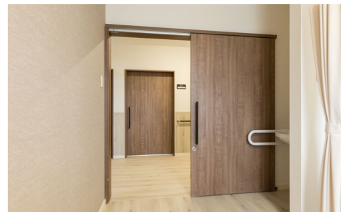
室内ドア：おもいやりドア〈トープグレー柄〉