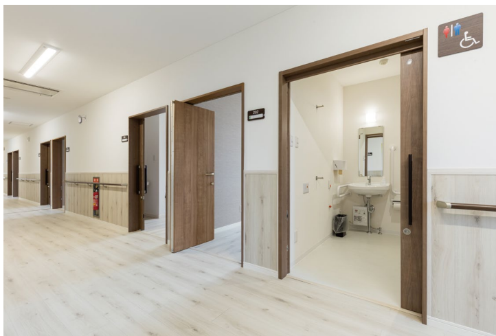
室内ドア（右から2番目を除く）：おもいやりドア〈トープグレー柄〉 室内ドア（右から2番目）：おもいやりドア（特注品）〈トープグレー柄〉 手摺：システム手摺35型 ゴム集成材タイプ手摺〈ダルブラウン色〉