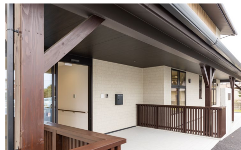
軒天井材：ダイライト軒天45〈オフブラック柄〉