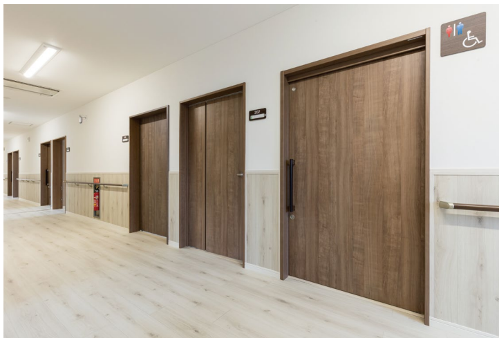
室内ドア（右から2番目を除く）：おもいやりドア〈トープグレー柄〉 室内ドア（右から2番目）：おもいやりドア（特注品）〈トープグレー柄〉 手摺：システム手摺35型 ゴム集成材タイプ手摺〈ダルブラウン色〉