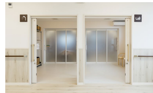
室内ドア：おもいやりドア〈ネオホワイト柄〉 手摺：システム手摺35型 ゴム集成材タイプ手摺〈ダルブラウン色〉