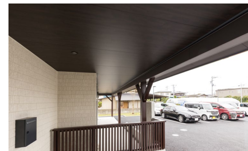
軒天井材：ダイライト軒天45〈オフブラック柄〉