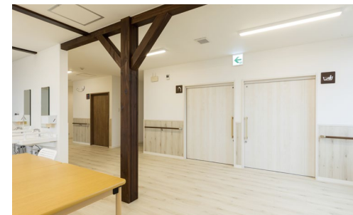
室内ドア（右側）：おもいやりドア〈ネオホワイト柄〉 室内ドア（左側）：おもいやりドア〈トープグレー柄〉 手摺：システム手摺35型 ゴム集成材タイプ手摺〈ダルブラウン色〉