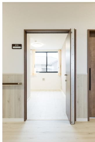
室内ドア：おもいやりドア（特注品）〈トープグレー柄〉 手摺：システム手摺35型 ゴム集成材タイプ手摺〈ダルブラウン色〉