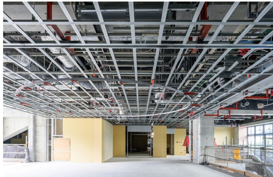
耐震天井工法: ダイケンハイブリッド天井 落下低減天井DH