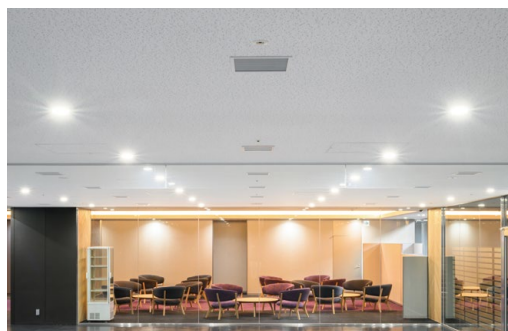
耐震天井工法: ダイケンハイブリッド天井 落下低減天井DH 天井材: ダイロートン トラバーチン9mm