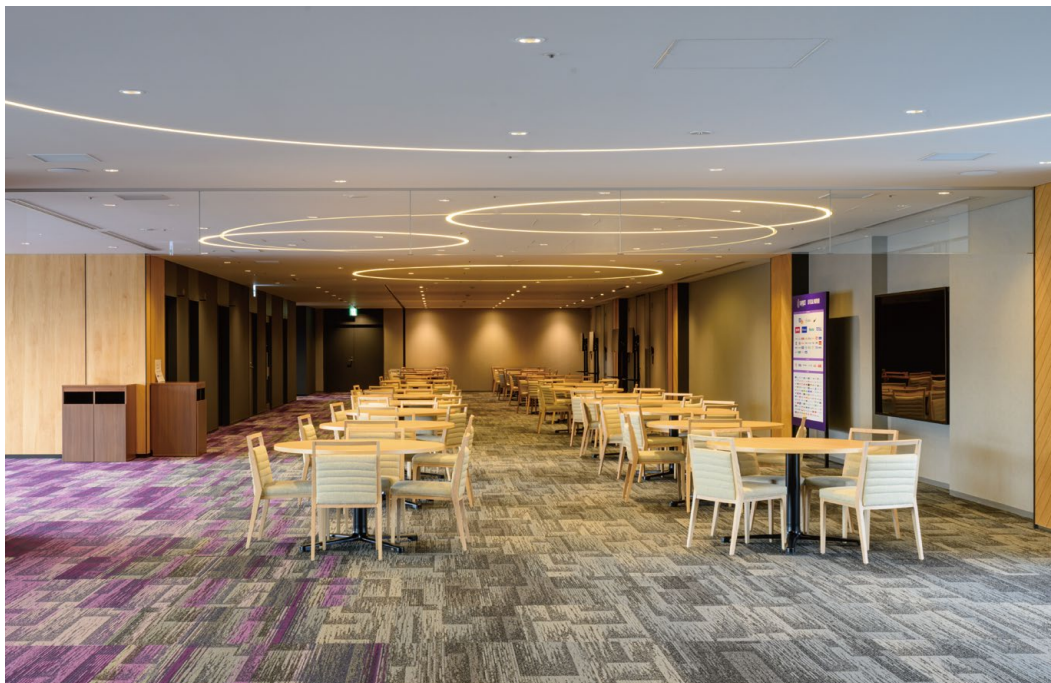
耐震天井工法: ダイケンハイブリッド天井 落下低減天井DH