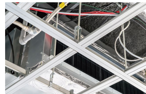
耐震天井工法: ダイケンハイブリッド天井 落下低減天井DH