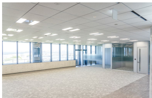
天井材:システム天井 クロスシリーズ グリッドタイプ ダイロートン12mmグリッド〈NDF柄〉600グリッド用 (バー材:DKG-2000)