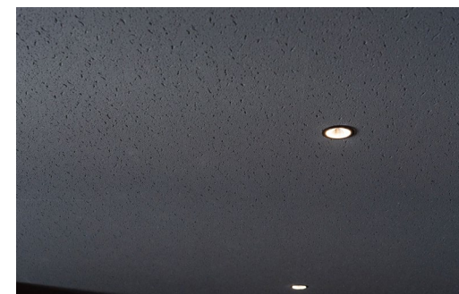
天井材:ダイロートン メタリック 〈トラバーチン(ブラック)〉