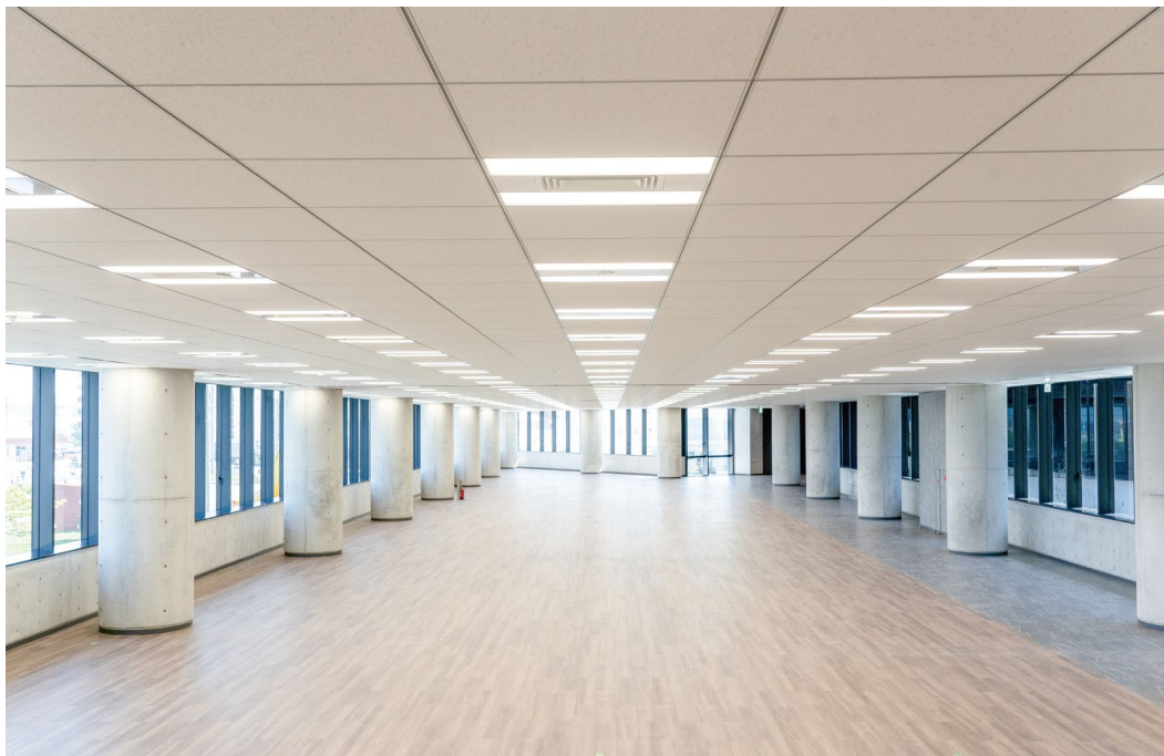
天井材:システム天井 クロスシリーズ グリッドタイプ ダイロートン12mmグリッド〈NDF柄〉600グリッド用(バー材:DKG-2000)