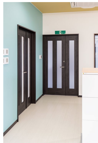
室内ドア: ハピアパブリック (特注品) 〈オフブラック〉