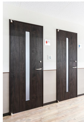
室内ドア: ハピアパブリック (特注品) 〈オフブラック〉