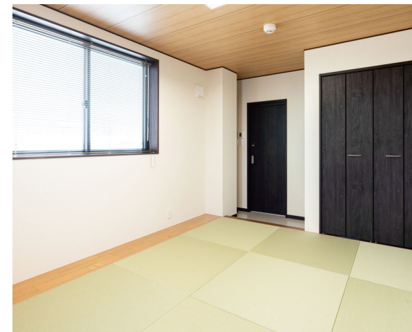
インテリア畳: こち和座 敷き込みタイプ 彩園 〈01グリーン〉 室内ドア: ハピアパブリック (特注品) 〈オフブラック〉