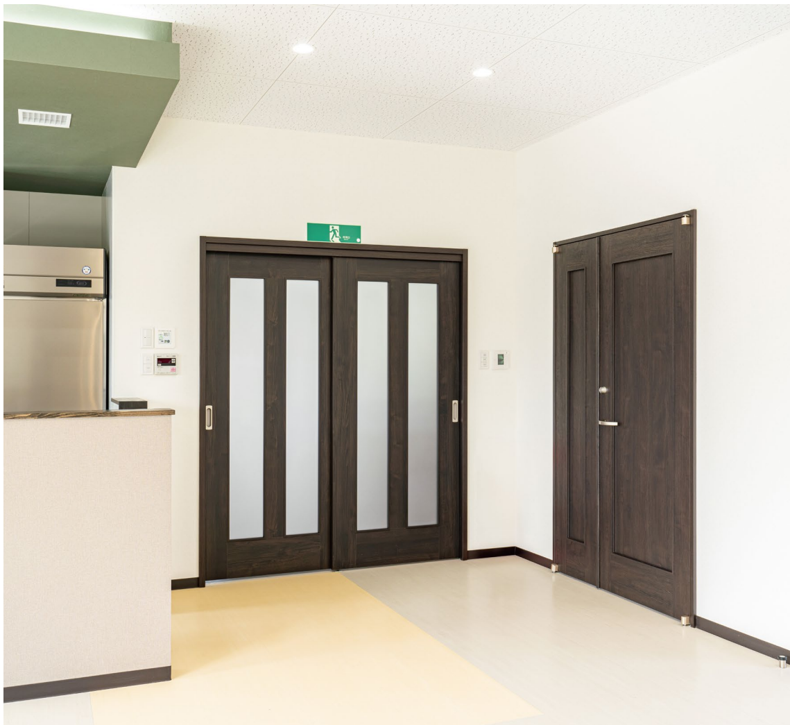
室内ドア: ハピアパブリック (特注品) 〈オフブラック〉