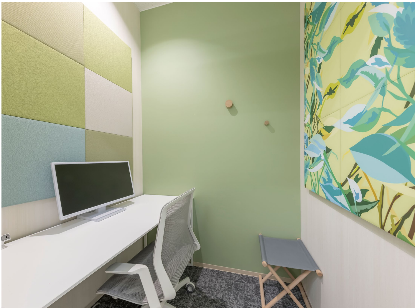
吸音パネル:OFF TONE (オフトーン) マグネットパネルN<TW柄><16> 吸音パネル:OFF TONE (オフトーン) マグネットパネルN<PR柄><07><61><67> 吸音パネル:OFF TONE (オフトーン) マグネットパネルN インクジェット特注対応