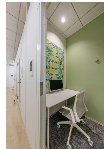
吸音パネル:OFF TONE (オフトーン) マグネットパネルN インクジェット特注対応