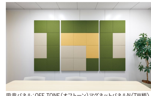
吸音パネル: OFF TONE (オフトーン) マグネットパネルN<TW柄>〈01〉〈19〉〈23〉