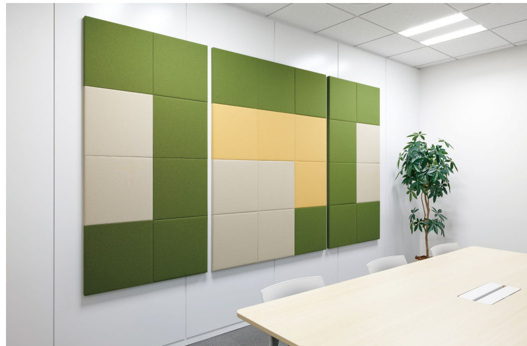
吸音パネル: OFF TONE (オフトーン) マグネットパネルN<TW柄>〈01〉〈19〉〈23〉