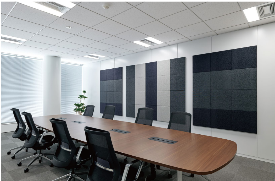
吸音パネル: OFF TONE (オフトーン) マグネットパネルN<AN柄>〈04〉〈15〉〈20〉