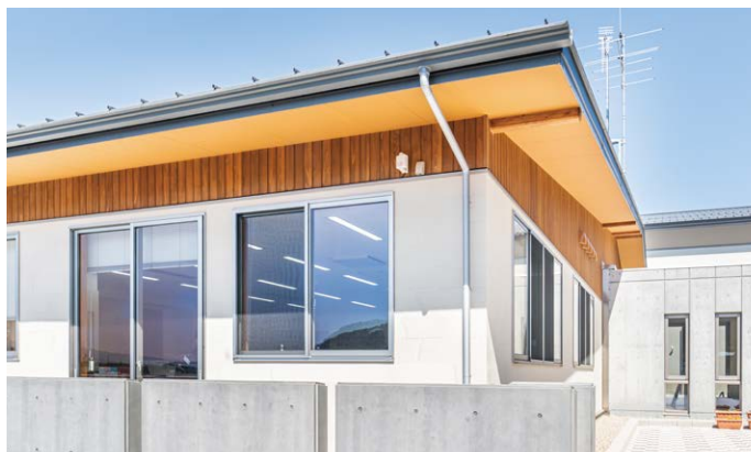
軒天井材: ダイライト軒天45 (現場塗装品)