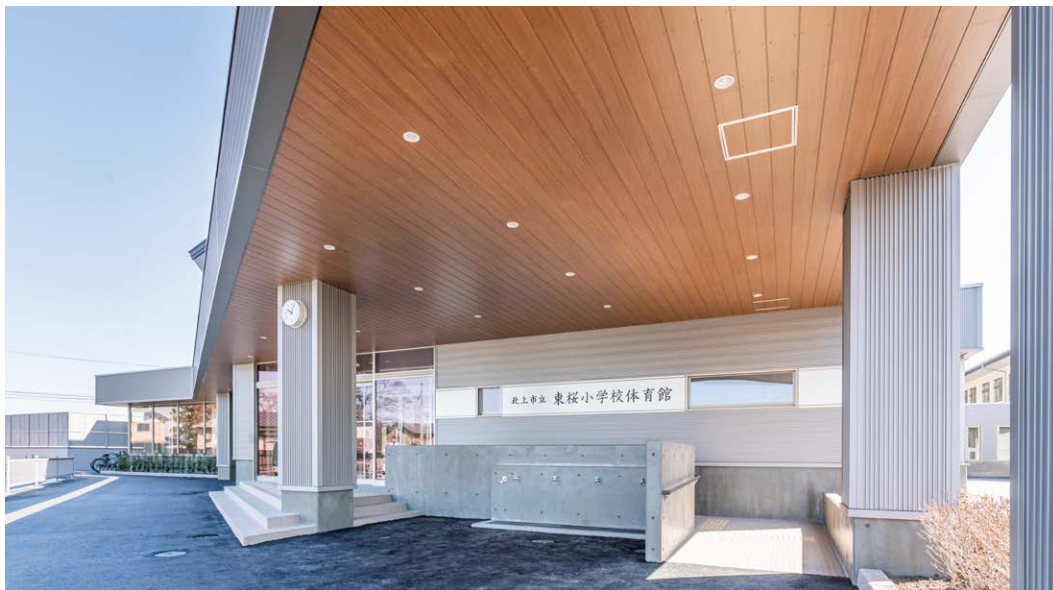
軒天井材: ダイライト軒天羽目板<ティーブラウン>