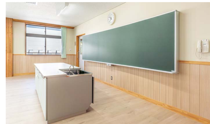
壁材: グラビオ羽目板R<ライトオーカー>