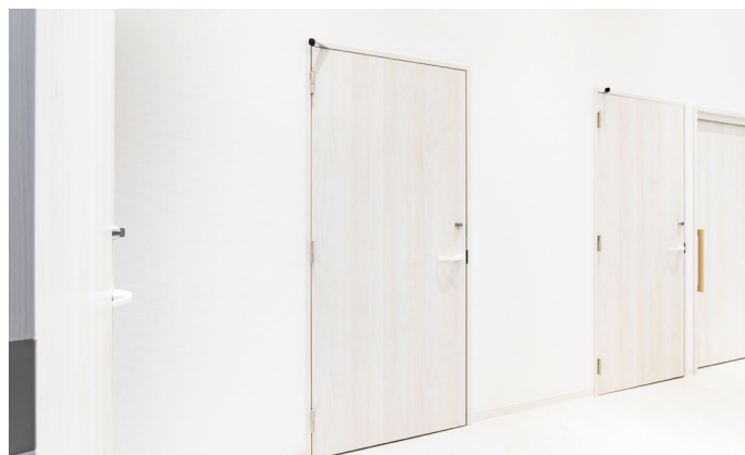
室内ドア：防音ドアWタイプ [G30] 片開き〈ネオホワイト〉 室内ドア：おもいやリドア〈ネオホワイト〉