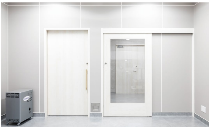
室内ドア：おもいやリアシストドア〈ネオホワイト〉 室内ドア：おもいやリドア〈ネオホワイト〉