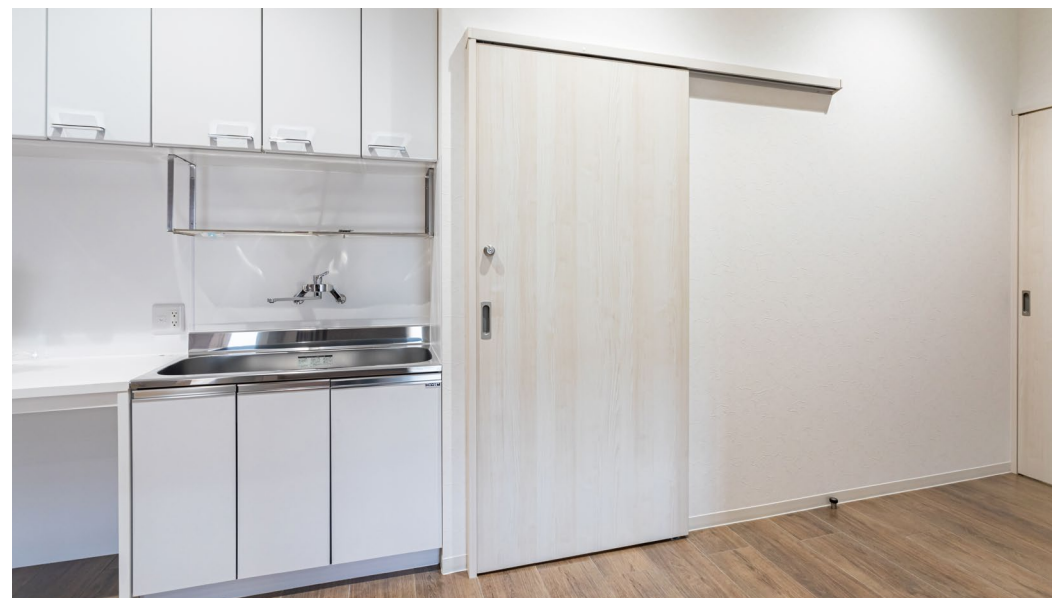
室内ドア：おもいやリドア〈ネオホワイト〉