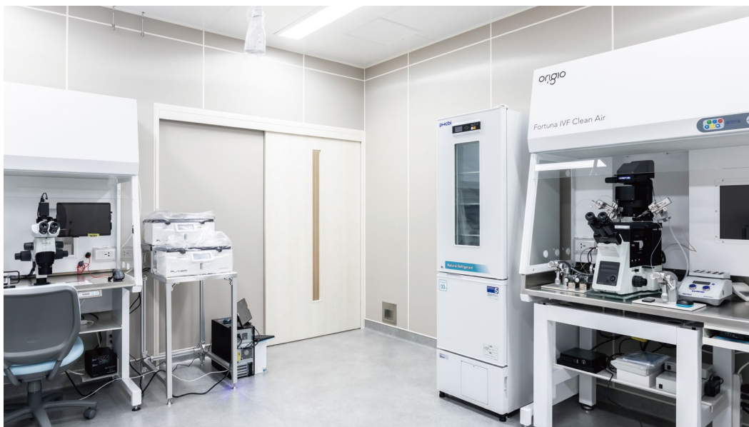
室内ドア：おもいやリアシストドア〈ネオホワイト〉