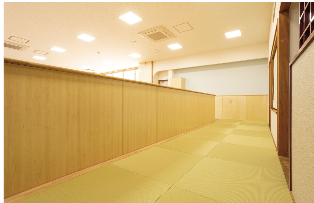
畳おもて:ダイケン健やかおもて 銀白100A〈16 若草色〉