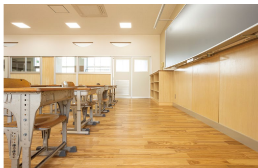
床材:コミュニケーションタフ DW〈アッシュ(クリア)〉