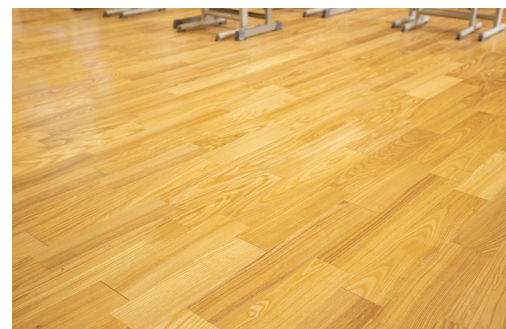
床材:コミュニケーションタフ DW〈アッシュ(クリア)〉