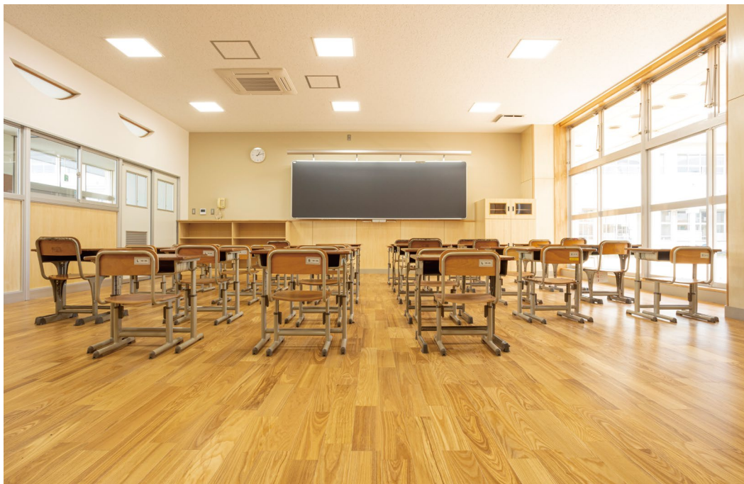
床材:コミュニケーションタフ DW〈アッシュ(クリア)〉