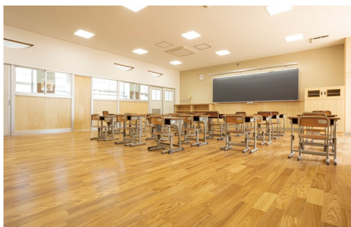
床材:コミュニケーションタフ DW〈アッシュ(クリア)〉