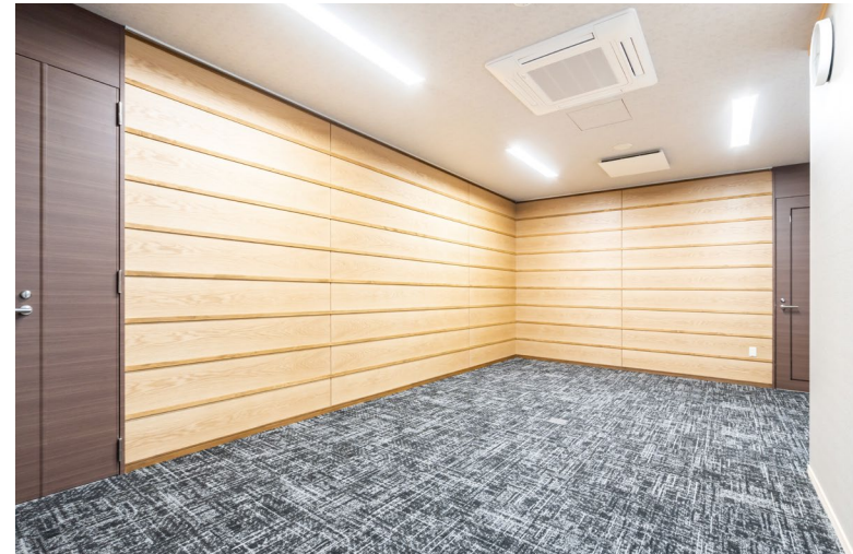
壁材: グラビオUS (特注品) (US13)