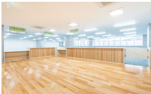
床材: コミュニケーションタフII DW (地域産材対応突板) (山梨産杉)