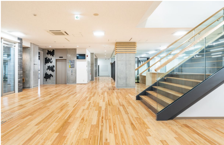
床材: コミュニケーションタフII DW (地域産材対応突板) (山梨産杉)