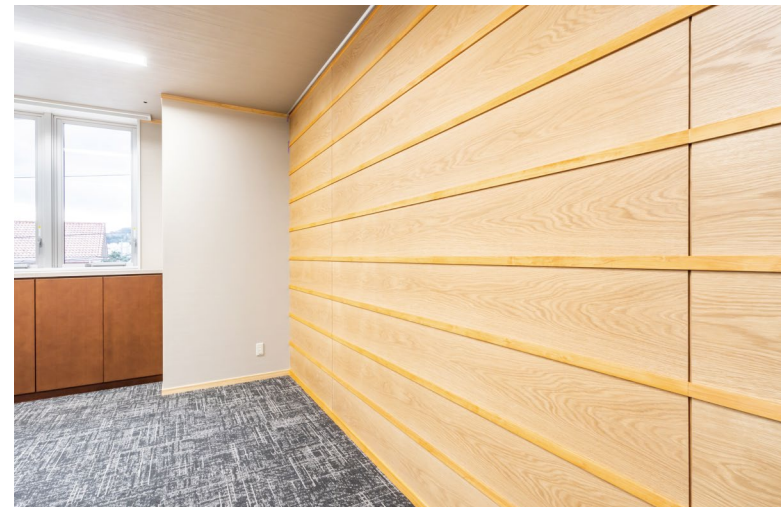
壁材: グラビオUS (特注品) (US13)