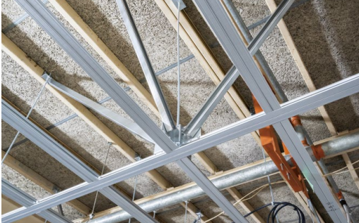
耐震天井工法: ハイブリッド天井