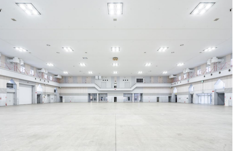
耐震天井工法: ハイブリッド天井 天井材: ダイロートン トラバーチン 12mm