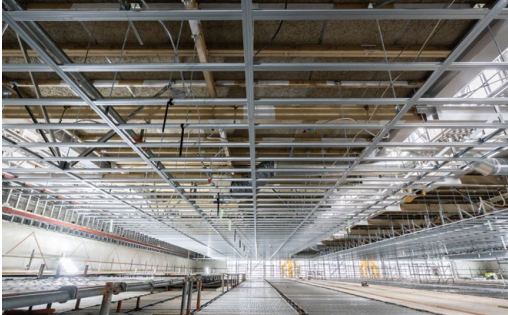
耐震天井工法: ハイブリッド天井