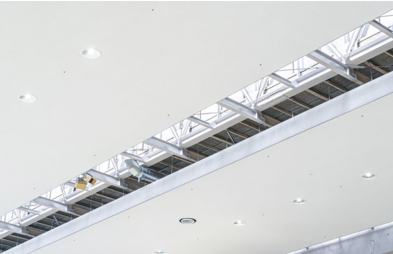
耐震天井工法: ハイブリッド天井 天井材: ダイロートン トラバーチン 12mm