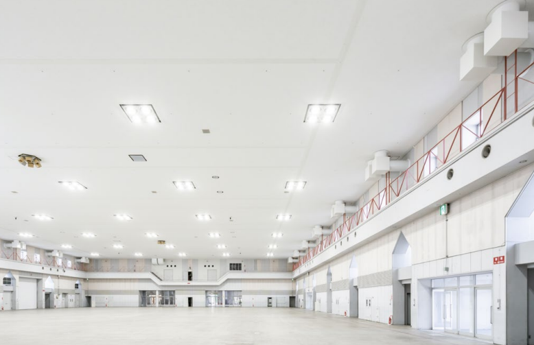
耐震天井工法: ハイブリッド天井 天井材: ダイロートン トラバーチン 12mm