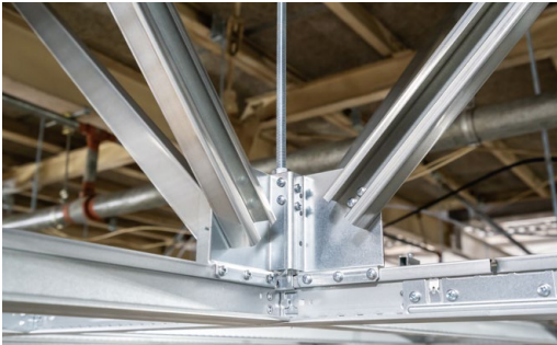
耐震天井工法: ハイブリッド天井