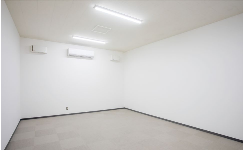
天井材: オトテン 専用ボーダー 音響壁下地材: オトカベS-3 防音施工部材: 吸音ウール455