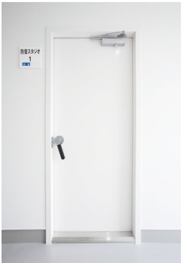
防音ドア: 防音ドアSFタイプ G40