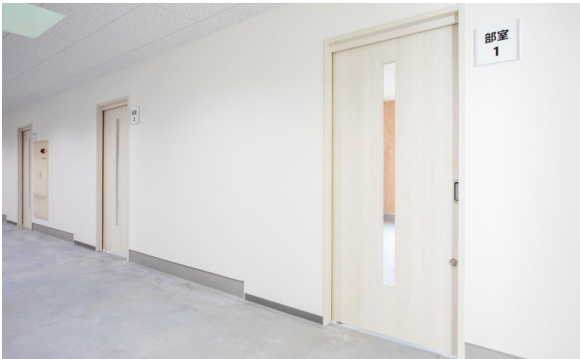
ドア: おもいやりドア (特注品) <ネオホホワイト>