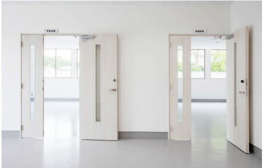
ドア: おもいやりドア (特注品) <ネオホホワイト>