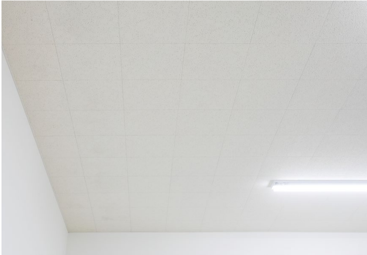
天井材: オトテン 専用ボーダー