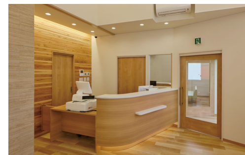
室内ドア (右側)：おもいやリアシストドア (特注品)〈ミルベージュ柄〉