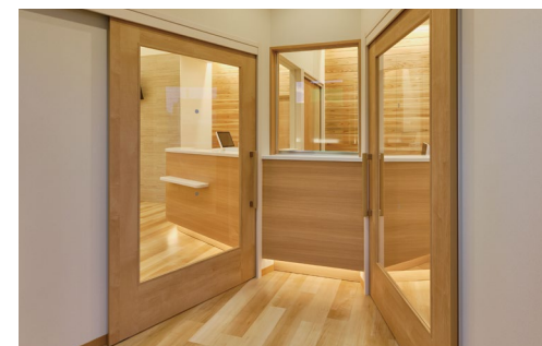
室内ドア：おもいやリアシストドア (特注品)〈ミルベージュ柄〉