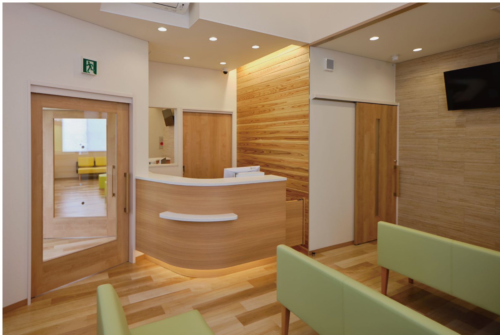
室内ドア (左側)：おもいやリアシストドア (特注品)〈ミルベージュ柄〉