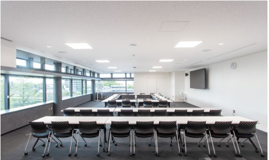
天井材:ロックウール化粧吸音板 ダイロートン トラバーチン9mm