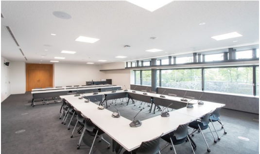
天井材:ロックウール化粧吸音板 ダイロートン トラバーチン9mm DAIKEN © DAIKEN CORPORATION 2025.04