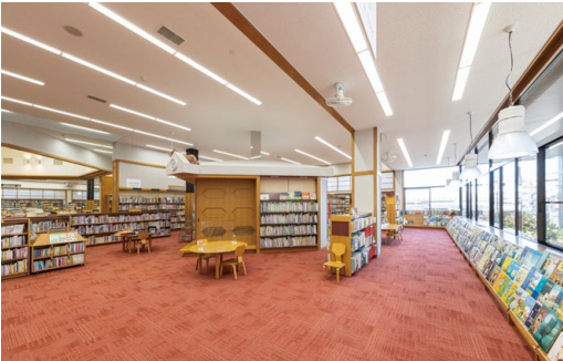
耐震天井工法: ダイケンハイブリッド天井 天井材: ロックウール化粧吸音板 ダイロートン トラバーチン9mm