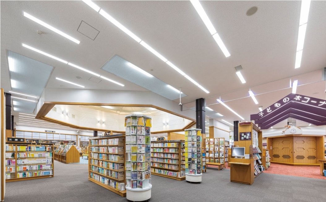
耐震天井工法: ダイケンハイブリッド天井 天井材: ロックウール化粧吸音板 ダイロートン トラバーチン9mm