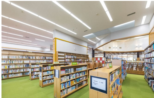
耐震天井工法: ダイケンハイブリッド天井 天井材: ダイロートトラバーチン9mm