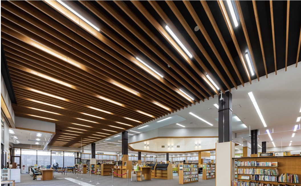
耐震天井工法: ダイケンハイブリッド天井 天井材: ロックウール化粧吸音板 ダイロートン トラバーチン9mm 天井造作材: グラビオルーバー UB 直付式〈ティーブラウン柄〉