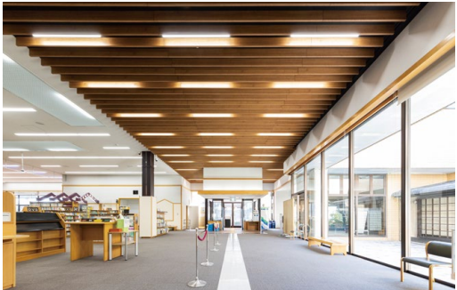
耐震天井工法: ダイケンハイブリッド天井 天井材: ロックウール化粧吸音板 ダイロートン トラバーチン9mm 天井造作材: グラビオルーバー UB 直付式〈ティーブラウン柄〉