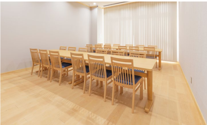
床材：コミュニケーションタフ FW〈ハードメープル〉