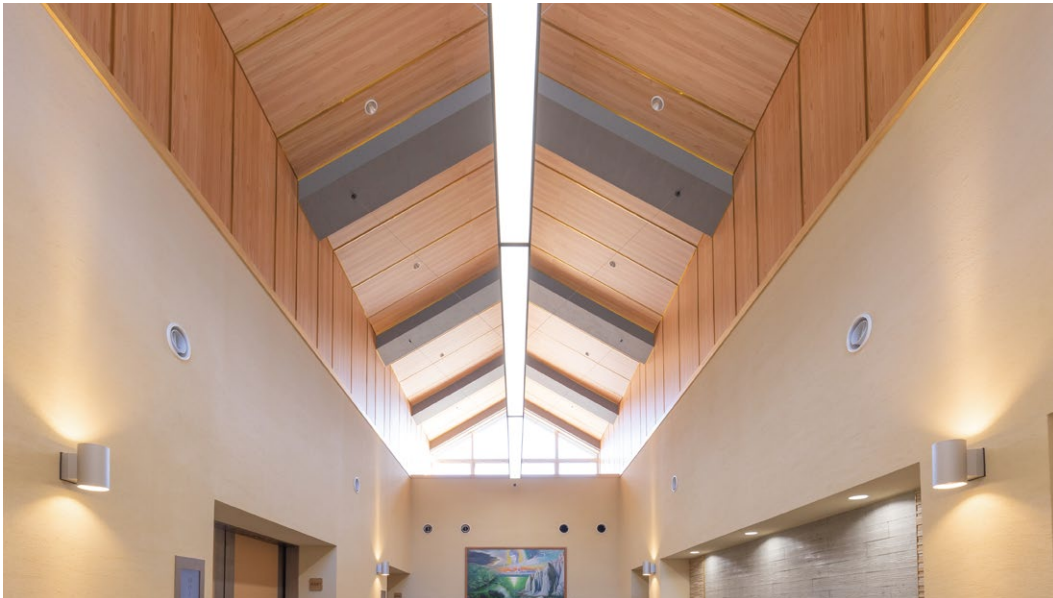
不燃壁材：グラビオUS〈青森県産杉〉※