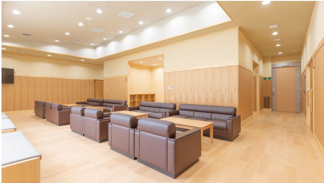
床材：コミュニケーションタフ FW〈ハードメープル〉