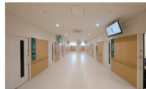
天井材:ダイロートン トラパーチン