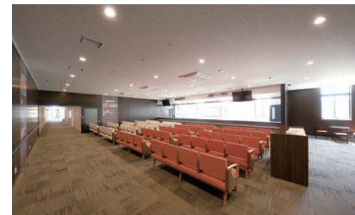
天井材:ダイロートン ワイド直張 壁材・腰壁:鹿児島県産材突板張り ダイライト不燃パネル