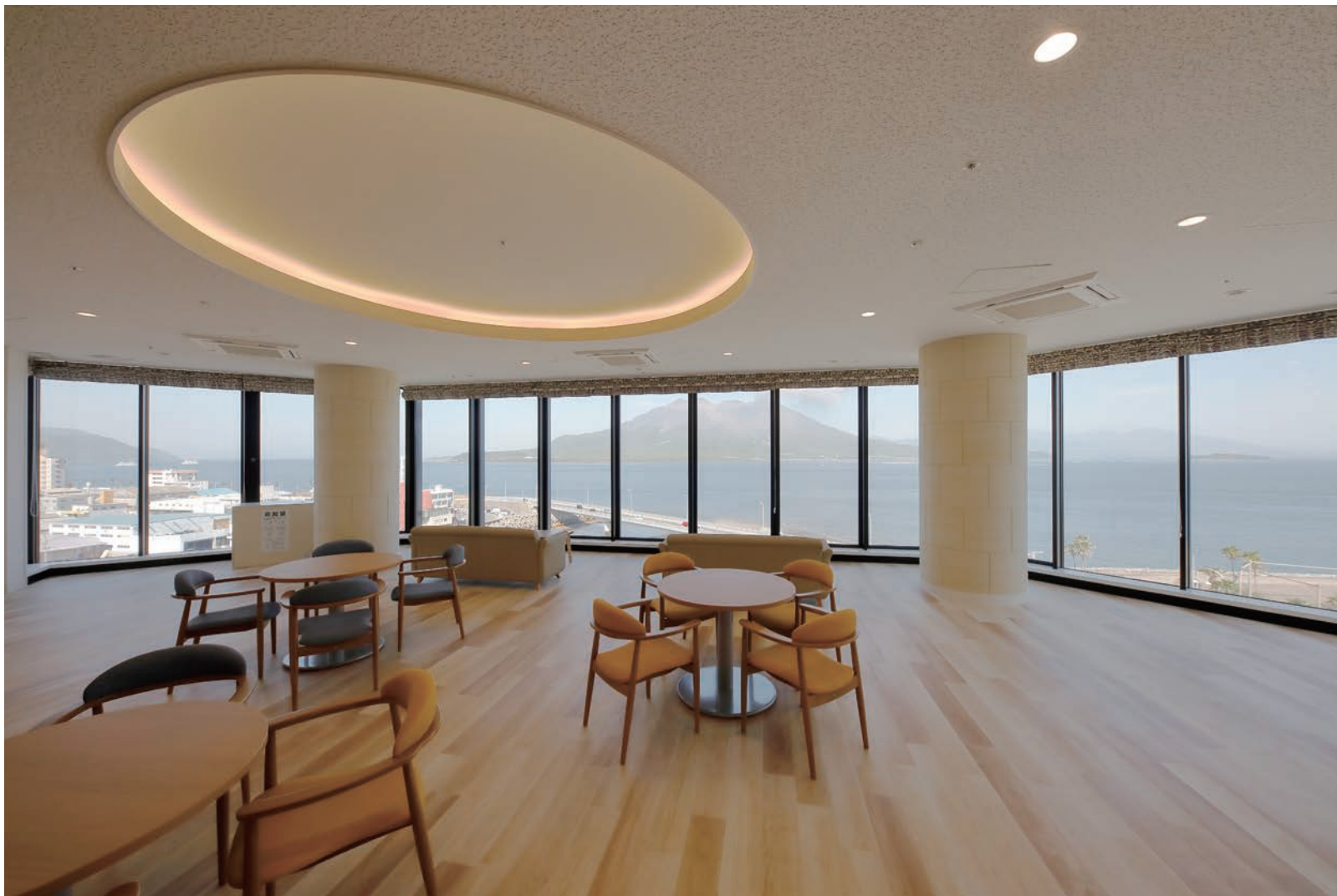
天井材:ダイロートン ワイド直張