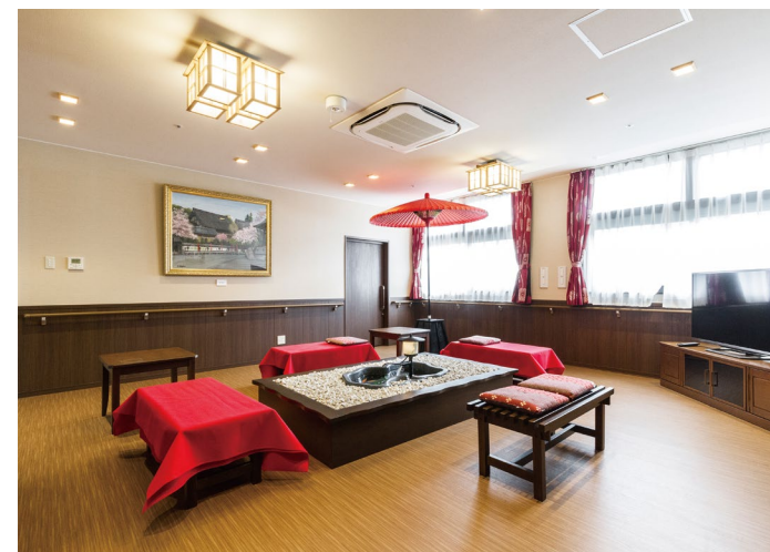
腰壁・腰壁：ハピアウォール ハードタイプ（同等品）〈ダルブラウン柄〉 室内ドア：おもいやりドア〈ダルブラウン柄〉