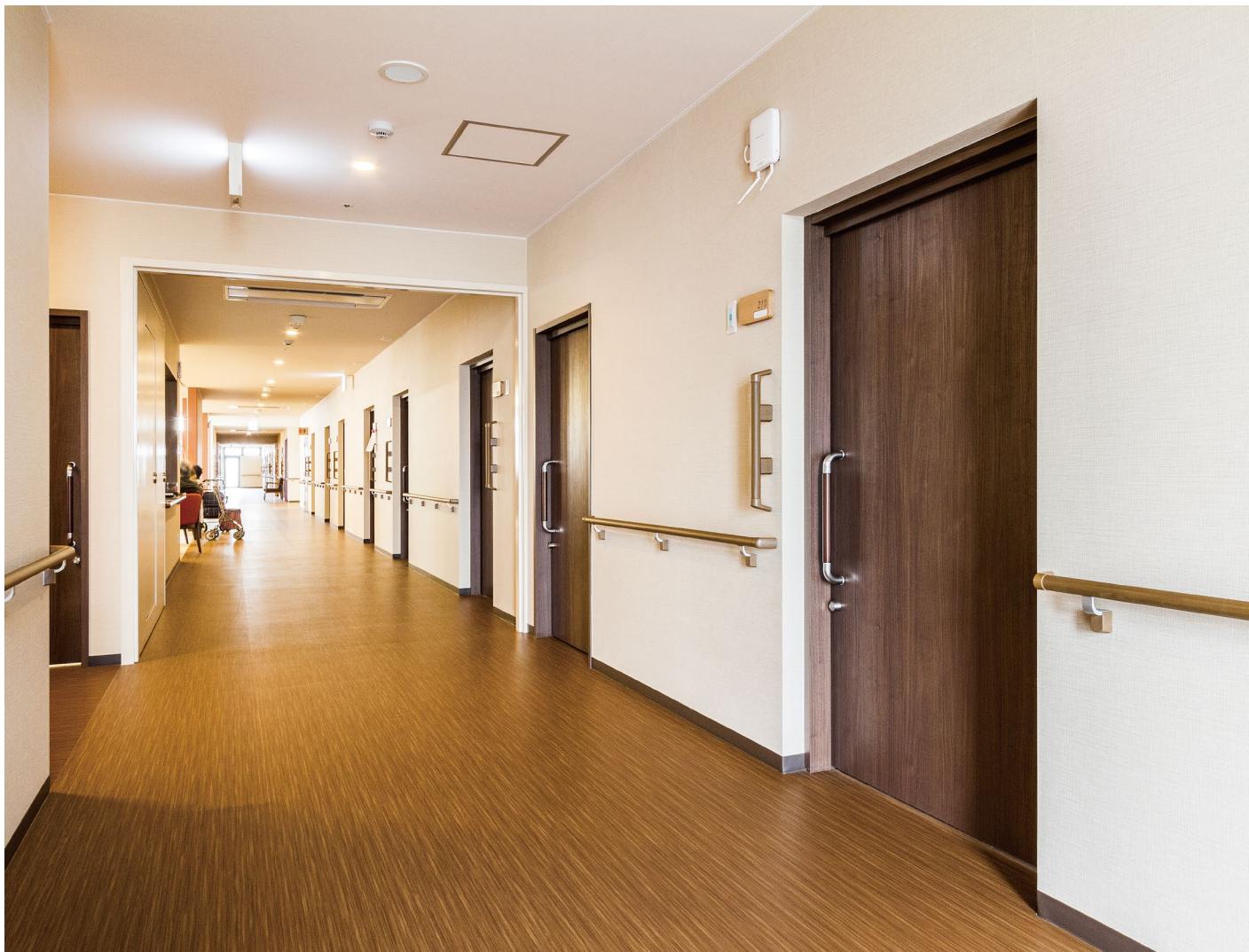
室内ドア：おもいやりドア〈ダルブラウン〉